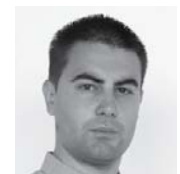
Владе Радуловић војно-политички аналитичар