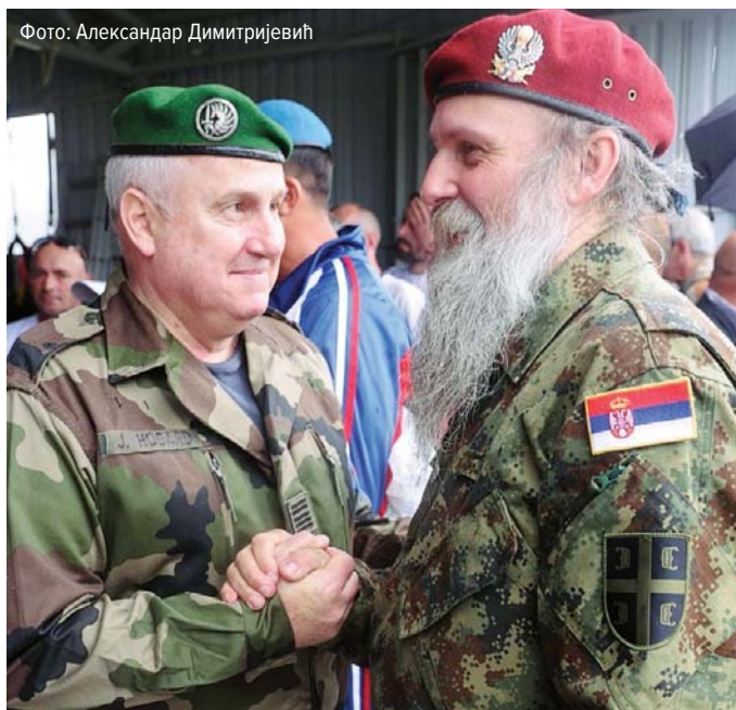
Фото: Александар Димитријевић

– Жак Огар је човек који ће умрети усправно. |