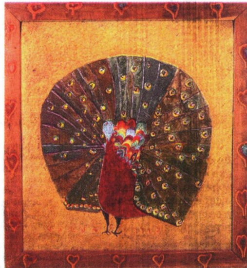
Илија Башичевић Босиљ, „Паун”, 1969.