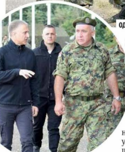
Министар Небојша Стефановић