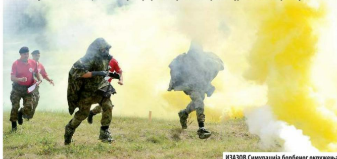
ИЗАЗОВ Симулација борбеног окружења

Његове речи на делу су потврдиле припадници Војске Србије, чланови наше трочлане екипе, приказујући завидну спремност и