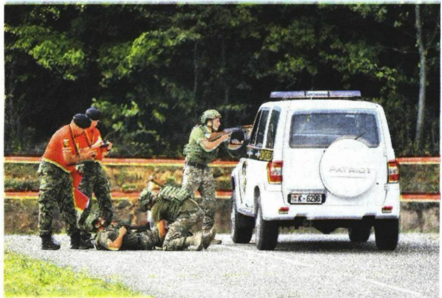
Атрактиван наступ војника на полигону „Берановац”