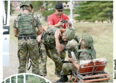
ОДГОВОРНОСТ Збрињавање рањеника

спретност у дисциплини "Патролна стаза војног полицајца". Задатак да на полигону савладају 13 изазова из комбинованих сегмената војнополицијске вештине, обуке и процедуре, од савладавања препрека, преко бацања бомби и збрињавања рањеника, па до интервенције приликом хапшења, наши војни полицајци решили су за само девет минута и 29 секунди.