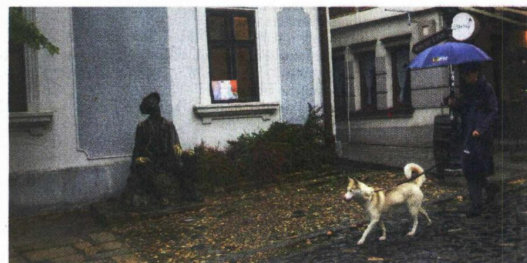
У Кућу Ђуре Јакшића улази се по двоје-троје, а маске су обавезне