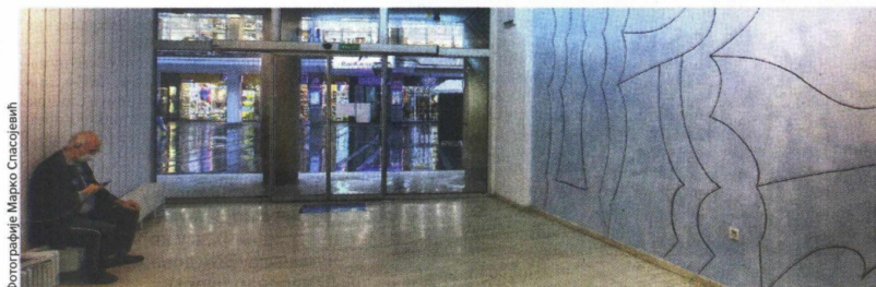
„Анализирање“ поставке у КЦБ-у