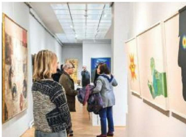
Изложба ће трајати до 3. фебруара