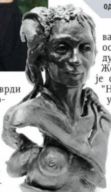
▲ "Амазонка скакаваца"