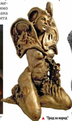
▲ "Град за народ"