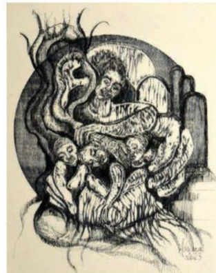
▲ "Мајка мојих јаја"

- Дакле, на њене скулптуре не треба само бацити поглед. Напротив, хајде да одвојимо време да се загледамо у њих, да их испитамо, да у њима уживамо да бисмо ценили њихово богатство. То су рогови изобиља. Одвојимо време да ослушкујемо њихове одјеке у нама, оне који нам откривају нашу сопствену машту у њеним проживљеним, згужва-