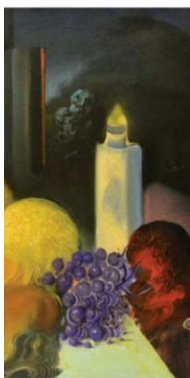
зић, "Аутопортрет са воћем"