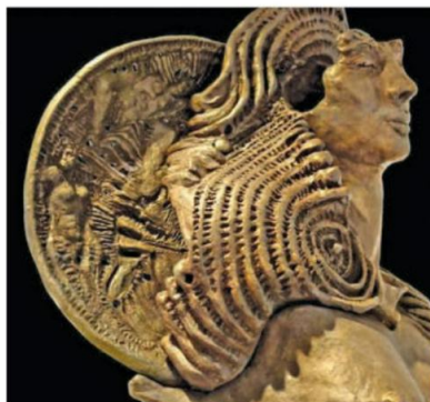
▲ "Дама једнорог"