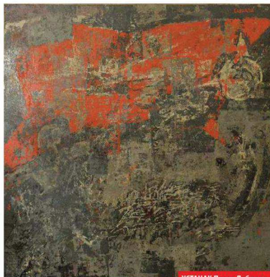
УСТАНАК Петар Лубарда

ке пете године под именом "НОБ у делима ликовних уметника Југославије". Са свих шест изложби дела су откупљивана, а данас их баштини Дом Војске Србије, у чијој Великој галерији ће сутра у 13 часова бити отворена изложба одабраних радова