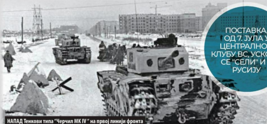
НАПАД Тенкови типа "Черчил МК IV" на првој линији фронта