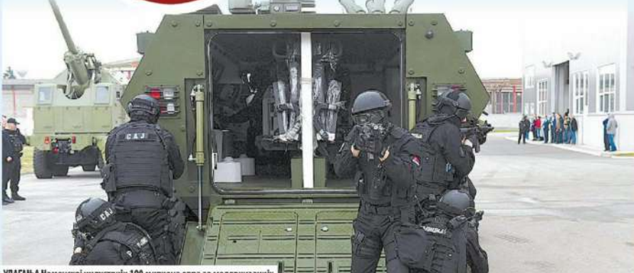
УЛАГАЊА Наменској индустрији 100 милиона евра за молекулацију

МОГАО БИ ЗАГРЕБ БЕЗ СВАКЕ НАФТЕ, АЛИ БЕЗ МРЖЊЕ ПРЕМА ВУЧИЋУ И СРБИЈИ НЕ МОГУ