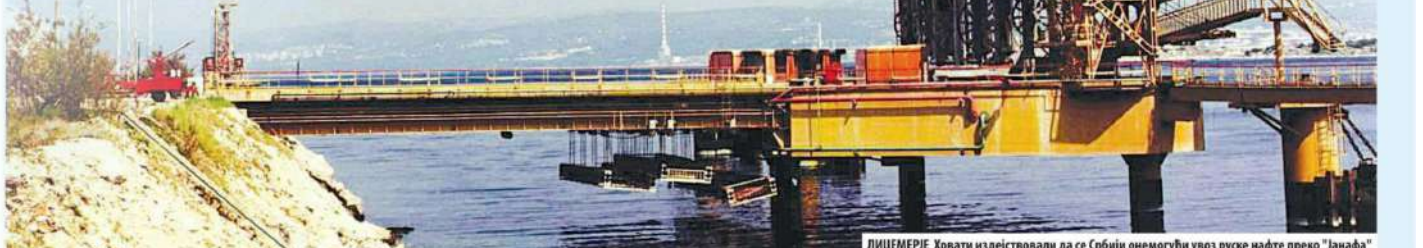
ЛИЦЕМЕРЈЕ Хрвати издејствовали да се Србији онемогући увоз руске нафте преко "Јанафа"

- Инвестиције нам живот значе. Оно нам обезбеђује сигурност. Ми ћемо у наредних годину