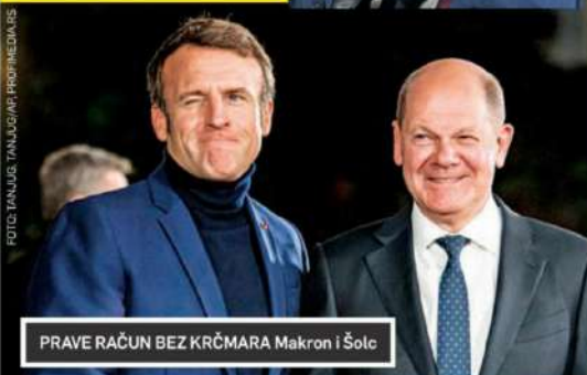
PRAVE RAČUN BEZ KRČMARA Makron i Šolc

Kada sam rekao da se menja arhitektura razgovora, iz EU su me demantovali, ali nisam razumeo čemu služi taj demanti