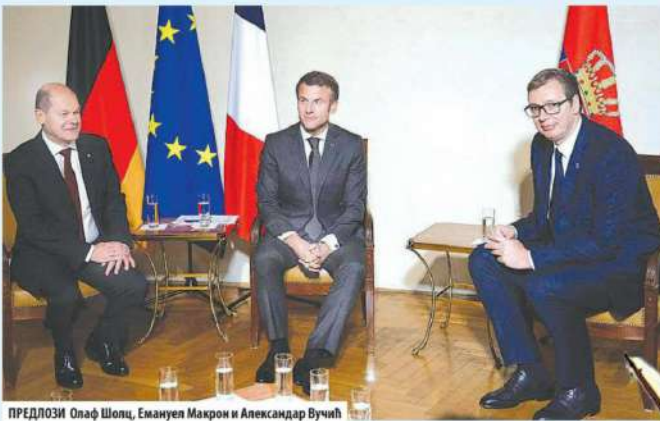
ПРЕДЛОЗИ Олаф Шолц, Емануел Макрон и Александар Вучић

твански. Открио је и да је са председником Француске Емануелом Макроном и канцеларом Немачке Олафом Шолцом разговарао о црвеним линијама Србије, али није желео да открива детаље.