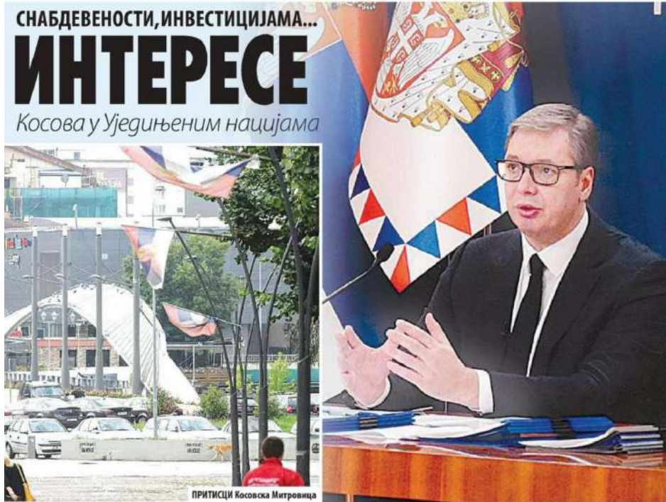
ПРИТИСЦИ Косовска Митровица