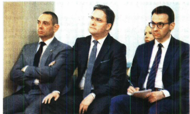
Александар Вулин, Никола Селаковић и Петар Петковић током обраћања Вучића

Што се тиче нафте, како је казао, Србија нема други нафтовод осим Ја-