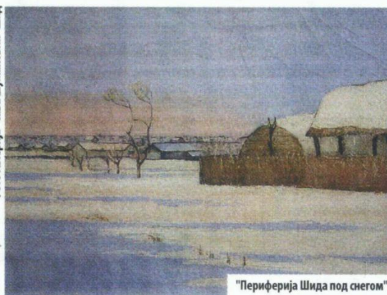
"Периферија Шиди под снегом"