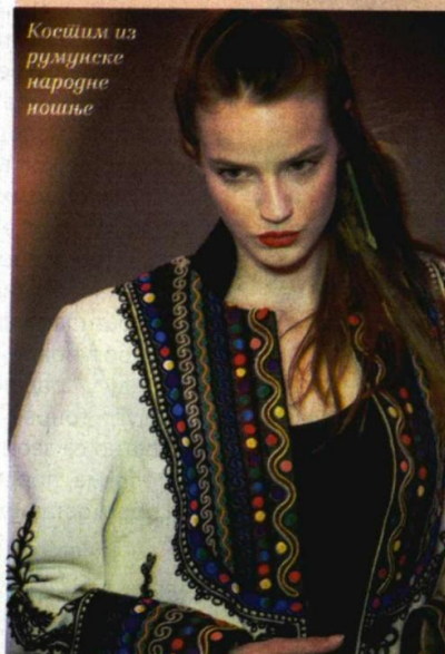
Косићим из румунске народне ношње