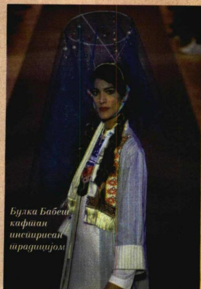
Булка Бабеш кафијан инспирисан традицијом