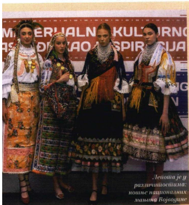
Лепота је у различитостима: ношње националних мањина Војводине