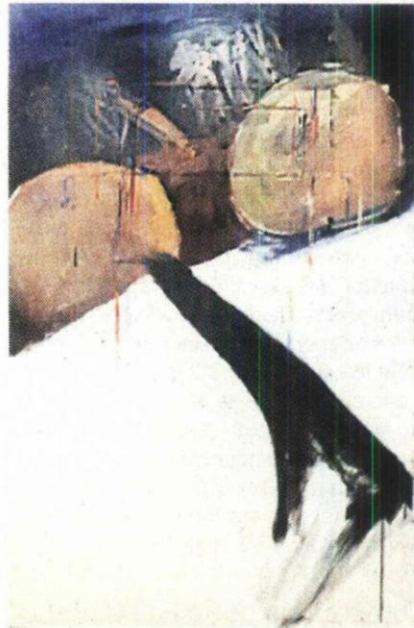
Последњи недовршен рад, 2021.

„И заиста, крочивши у амбијенталну целину уметничког дугогодишњег обитовања сусретом се са гомилом емоција које никога не могу оставити мирним, од љубичастих тонова сатканих љубавним осећањима и дела приређе-