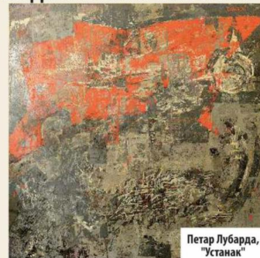
Петар Лубарда, "Устанак"