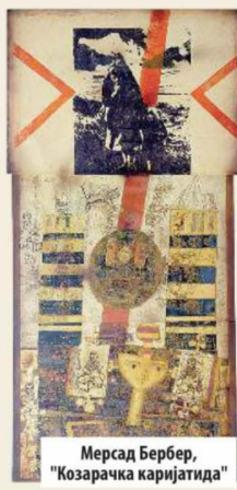
Мерсад Бербер, "Козарачка каријатида"