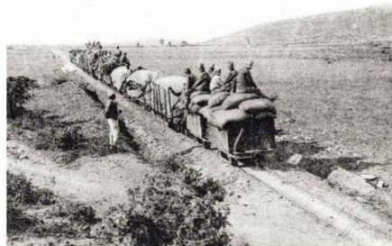
▲ СВЕДОЧАНСТВО Српска железница на Солунском фронту