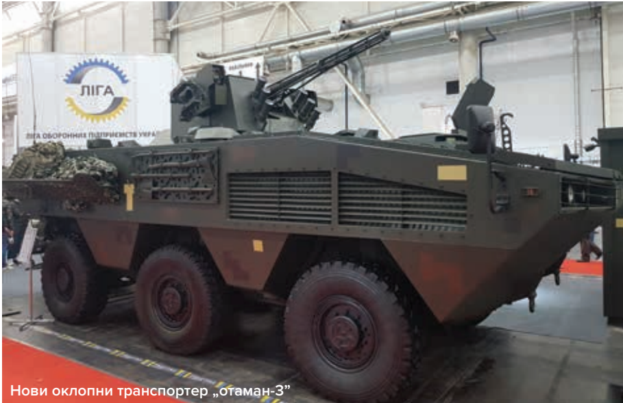
Нови оклопни транспортер „отаман-3”