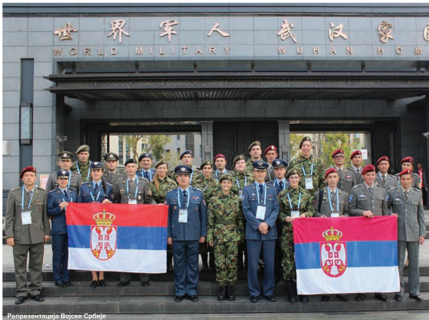
Репрезентација Војске Србије