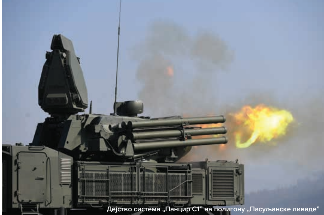
Дејство система „Панцир С1” на полигону „Пасуљанске ливаде”