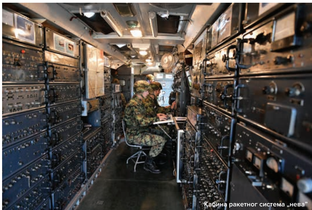
Кабина ракетног система „нева”