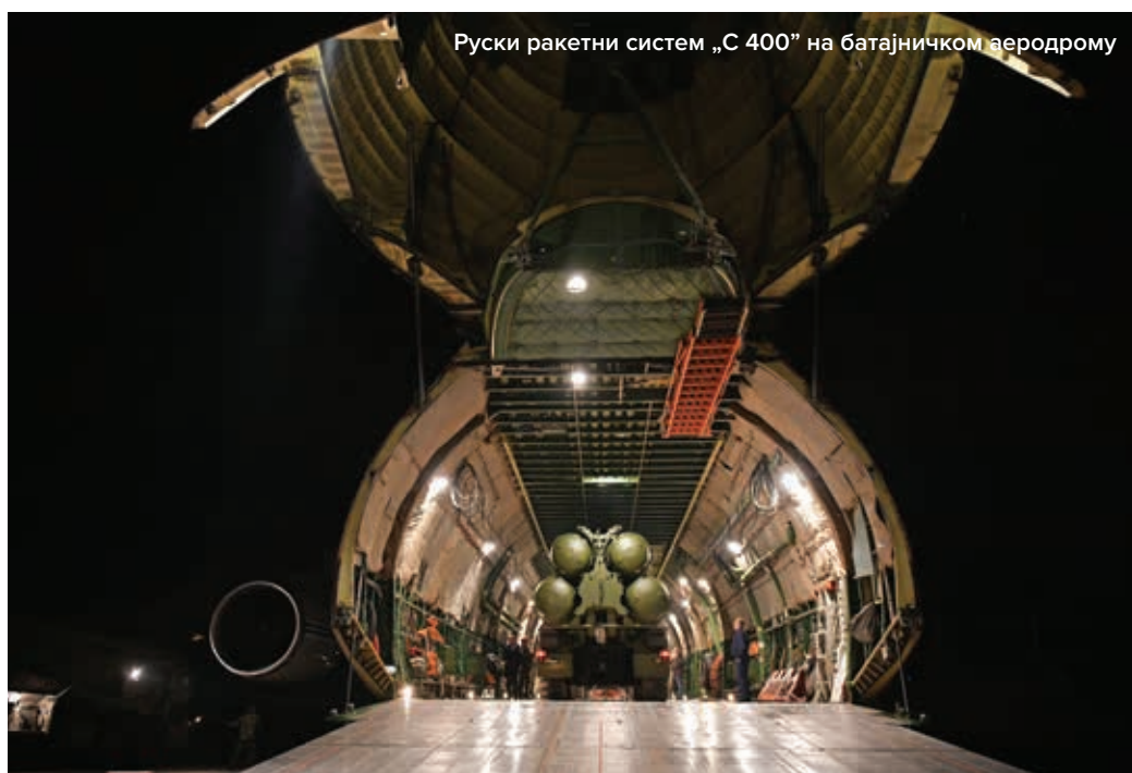
Руски ракетни систем „С 400” на батајничком аеродрому

ју које гарантује дуготрајни мир и да „Панцир С1” сада постаје део наоружања Војске Србије.