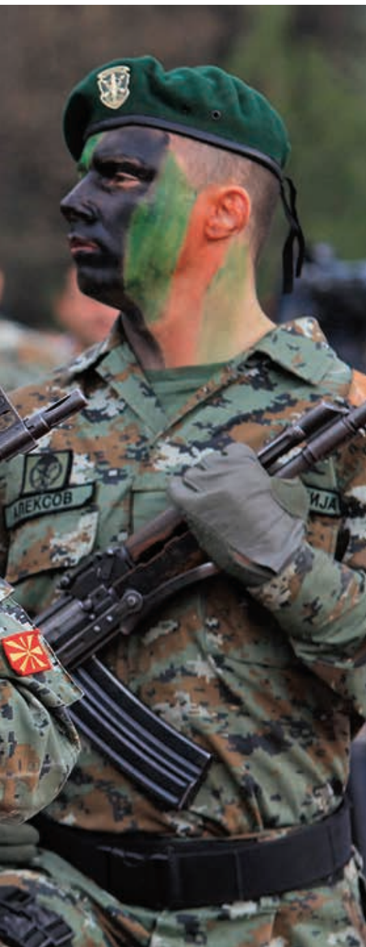
Пише Александар ЖИВОТИЋ

К онституисана као саставни део федералне и социјалистичке Југославије, а потом као самостална држава, Северна Македонија је током прве две деценије свог самосталног државног живота представљала крхку политичку творевину, која је свој новообликовани идентитет и суштински ограничен државни суверенитет темељила на доследном праћењу политике Западних сила у региону, оштром дистанцирању и негирању сваке реалне и историјске везе са Србијом као свом северном суседу и излажењу у сусрет нагло ојачалом и политички, економски, па и војно набујалом алабанском фактору. Иако се током последње деценије XX века чинило да је Македонија успела да одоли изазовима унутрашњих међуетничких сукоба и очува унутрашњу политичку стабилност, албанска побуна која је уследила 2001, а потом и постизање Охридског споразума, уз каснију Тиранску платформу и Преспански споразум, учинили су Северну Македонију дуалном и консензуалном државом, што је у основи угрозило суштину њене државности. На другој страни, најављени улазак у НАТО отворио је евроатлантску перспективу Северне Македоније. Да ли и у којој мери будуће чланство у северноатлантском војном савезу гарантује опстанак и територијалну целовитост Северне Македоније, остаје отворено питање које ће у будућности оптерећивати и тестирати односе између те земље и западног света.