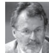
Др Миле Бјелајац Институт за новију историју Србије