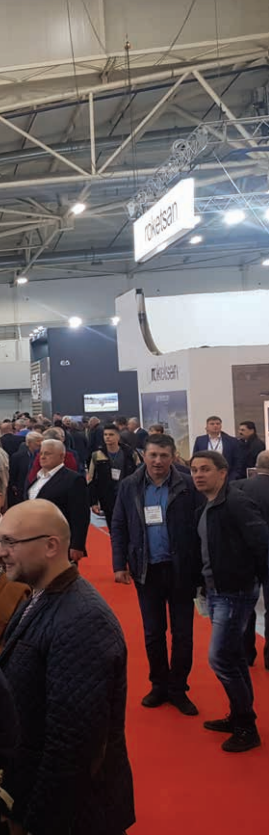
Текст и фото Владе РАДУЛОВИЋ

Кијев је друге недеље октобра био домаћин 16. међународног сајма наоружања и војне опреме „Arms and security 2019”. Иако је од последње манифестације тог типа у овом граду прошло тек годину дана, бројни излагачи из 16 земаља света представили су своја достигнућа у области одбране и заштите на око 34.000 квадратних метара изложбеног простора. Сајам су посетиле званичне делегације из 21 земље, потписано је неколико стратешких уговора, а укупан број посетилаца премашио је 20.000.