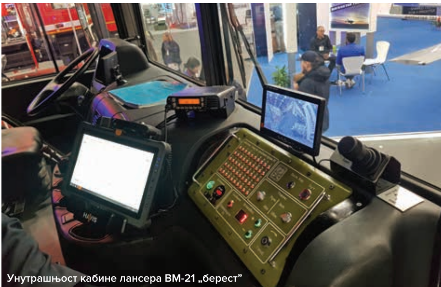
Унутрашњост кабине лансера BM-21 „берест”

чиме је и званично отпочела процедура за набавку 13 транспортних авиона нове генерације Ан-178 за потребе МУП-а.