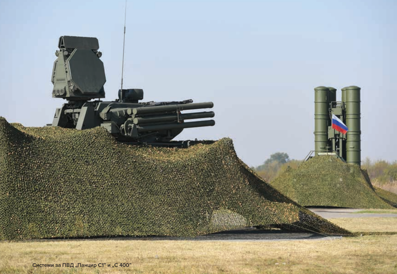
Системи за ПВД „Панцир С1” и „С 400”