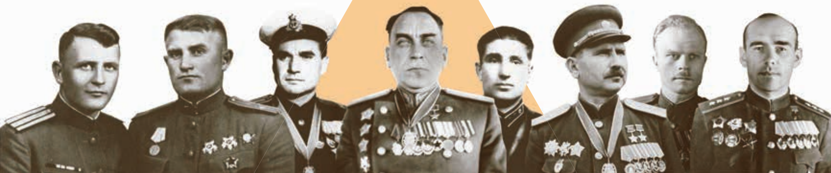
Генерал-пуковник авијације В. А. Судец