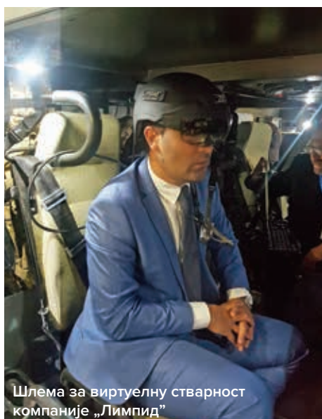
Шлема за виртуелну стварност компаније „Лимпид”