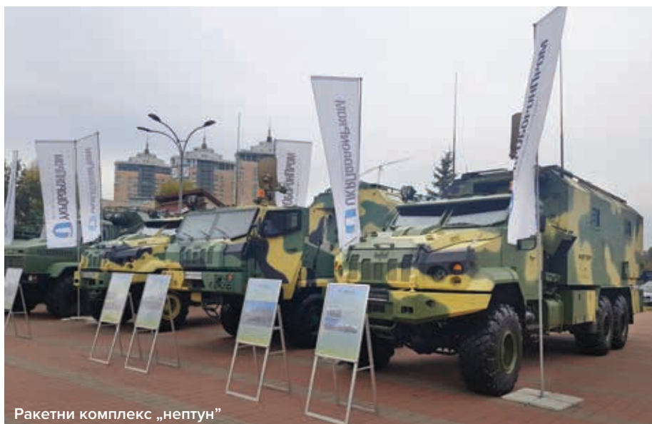
Ракетни комплекс „нептун”