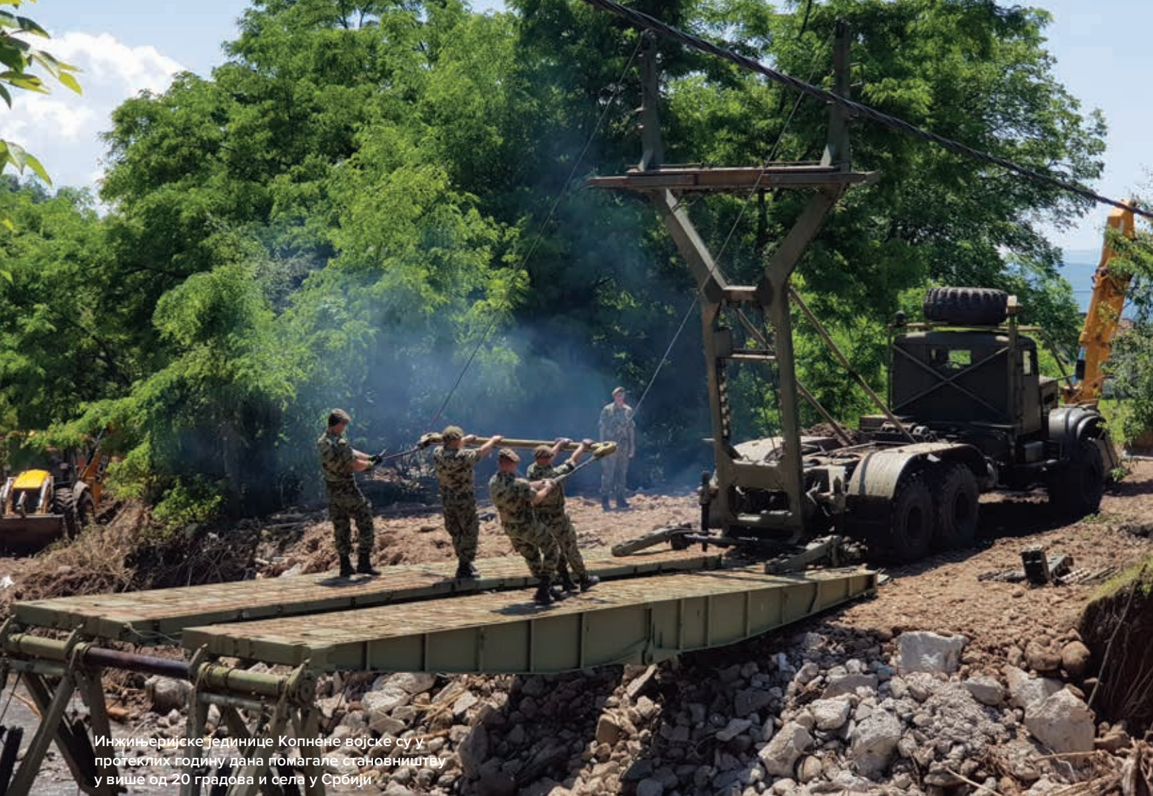
Инжињеријске јединице Копнене војске су у протеклих годину дана помагале становништву у више од 20 градова и села у Србији

јавног информисања и гостима, кроз свечани дефиле јединица и падобрански десант, прикаже део способности Војске и Полиције.