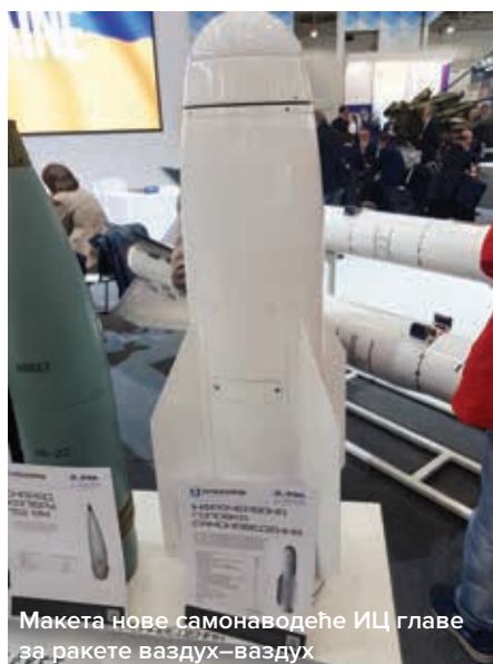
Макета нове самонаводеће ИЦ главе за ракете ваздух-ваздух

Када је реч о наоружању, на платформу треће генерације „отамана” постављен је чувени борбени модул БМ-7 „парус”, харковског конструкторског бироа „А. А. Морозова”, па посада има на располагању широк спектар наоружања – од аутоматског топа 30 mm и митраљеза 7,62 mm, до противоклопних ракета Barriер, домета до 5 km. Занимљиву иновацију представља увођење прозирне кабине, односно шлема за виртуелну стварност компаније „Лимпид”. Она је повезана са сетом спољашних камера и пружа на екранима кациге командира или другог члана посаде ре-