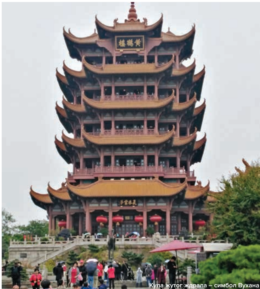
Кула жутог ждрала – симбол Вухана

хан је учинио све да такмичења и наш боравак овде буду на што вишем нивоу и у томе је потпуно успео. Указао бих и на велику конкуренцију у свим дисциплинама, тако да се војне игре изједначавају са светским и олимпијским такмичењима. Борбеност и спортски дух наших такмичара били су на високом нивоу и успели смо да освојимо три бронзане медаље, а неколико наших такмичара постигло је личне рекорде или резултат на нивоу својих ранијих учинака. Све то потврђује да је формирање Спортске јединице допринело јачању спорта у Војсци и са таквим приступом треба наставити како бисмо имали још спремније спортисте за овако изазовна такмичења. Важно је и да су спортисти прошли без озбиљнијих повреда. Укупан утисак је да су ове игре за нашу репрезентацију успешне и охрабру-