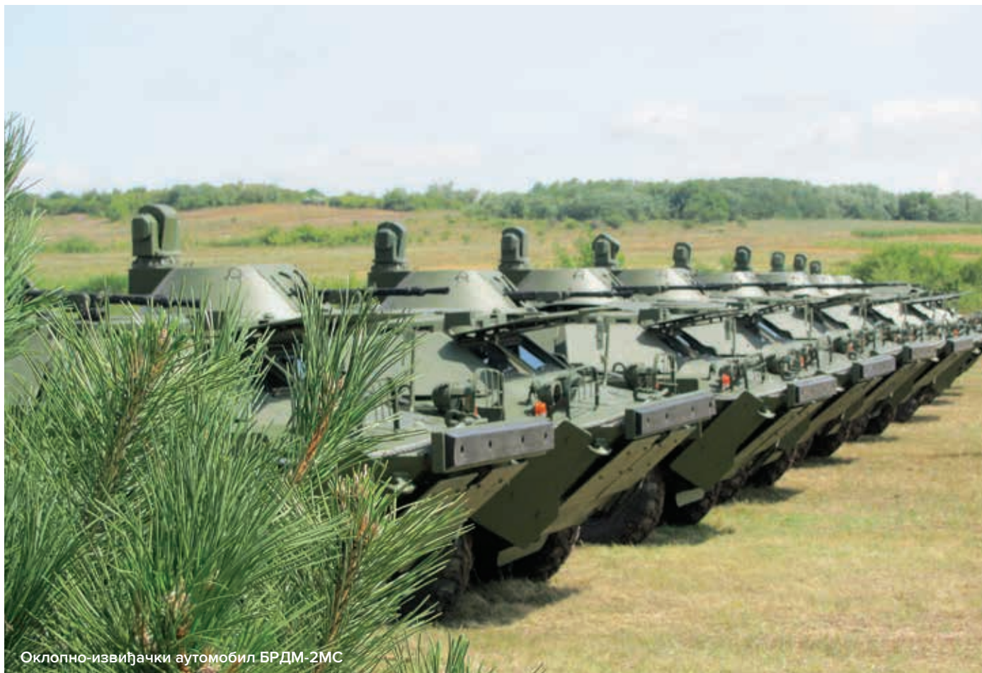
Оклопно-извиђачки аутомобил БРДМ-2МС