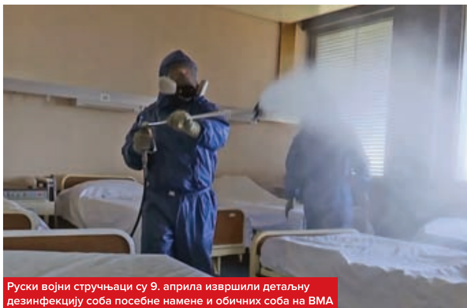
Руски војни стручњаци су 9. априла извршили детаљну дезинфекцију соба посебне намене и обичних соба на ВМА