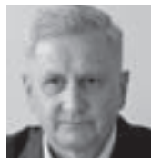
Бригадни генерал у пензији Стојан Коњиковац