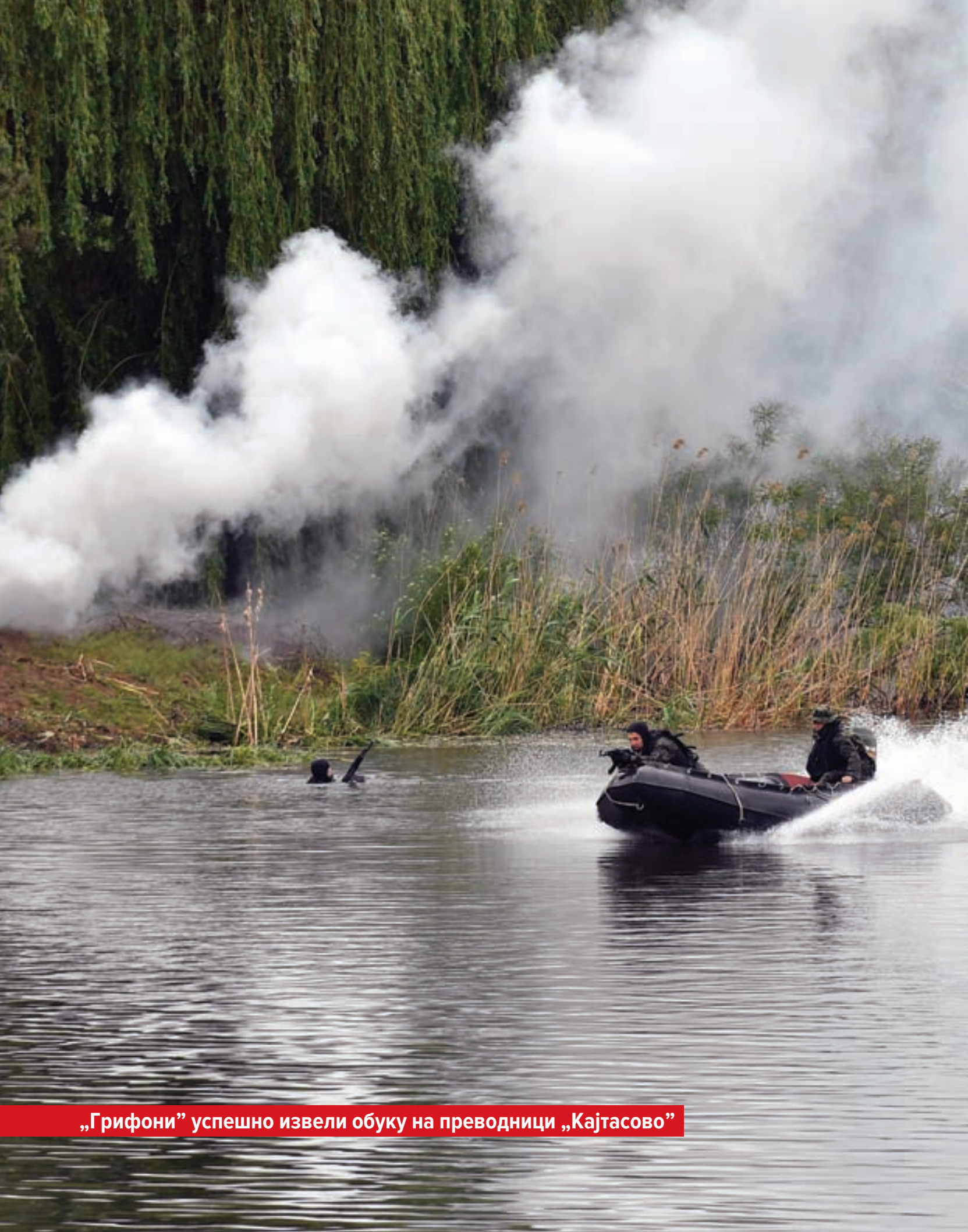
„Грифони” успешно извели обуку на преводници „Кајтасово”