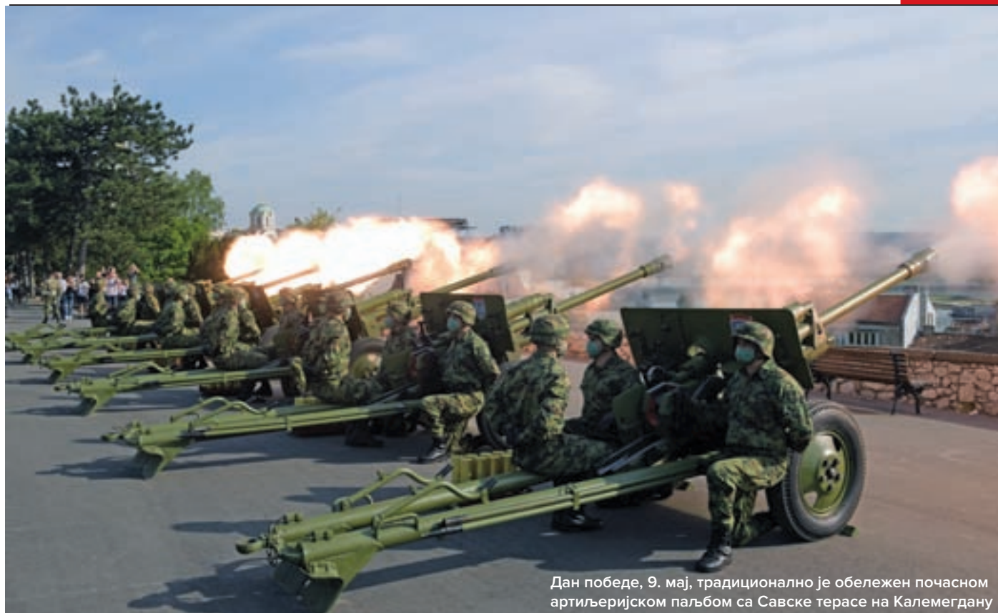
Дан победе, 9. мај, традиционално је обележен почасном артиљеријском паљбом са Савске терасе на Калемегдану