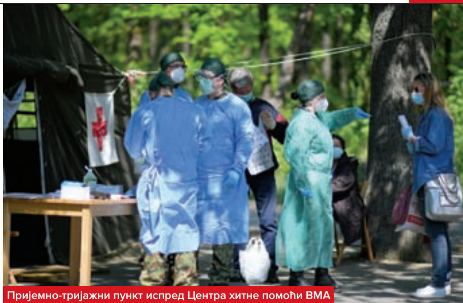
Пријемно-тријажни пункт испред Центра хитне помоћи ВМА

Прве мере предузете су још у јануару, када је у Кини харала епидемија вируса SARS-Cov-2, а болест почела да се шири на околне земље. Још тада је, сагледавајући актуелну епидемиолошку ситуацију у свету, Управа за војно здравство активирала Тим за командовање на нивоу Управе и кризне и стручне тимове у војноздрав-