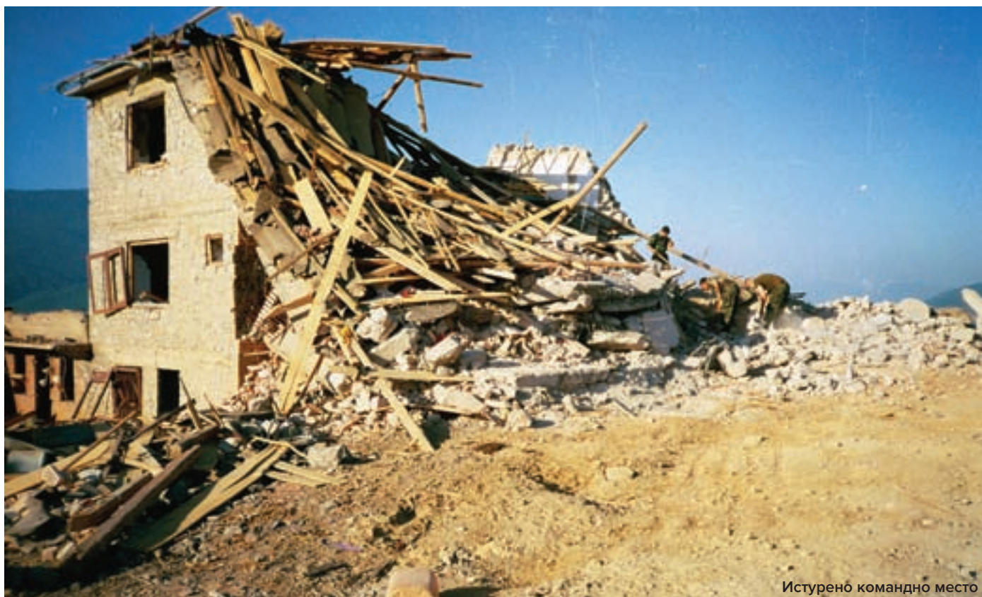
Истурено командно место >

По одобрењу Команде Корпуса, бригада је од 25. до 29. марта 1999. уништила 122 и 124. шиптарско-терористичку бригаду. У садејству са јединицама МУП-а, у троуглу Призрен – Сува Река – Ораховац, терористичке снаге су у потпуности уништене. Успоставили смо контролу територије, деблокирали путеве Сува Река – Ораховац и При-