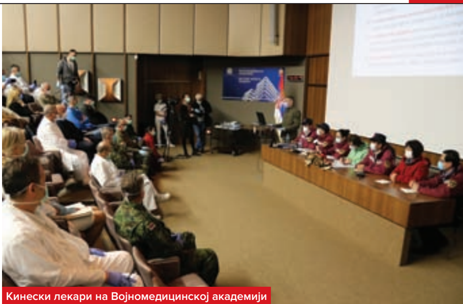
Кинески лекари на Војномедицинској академији