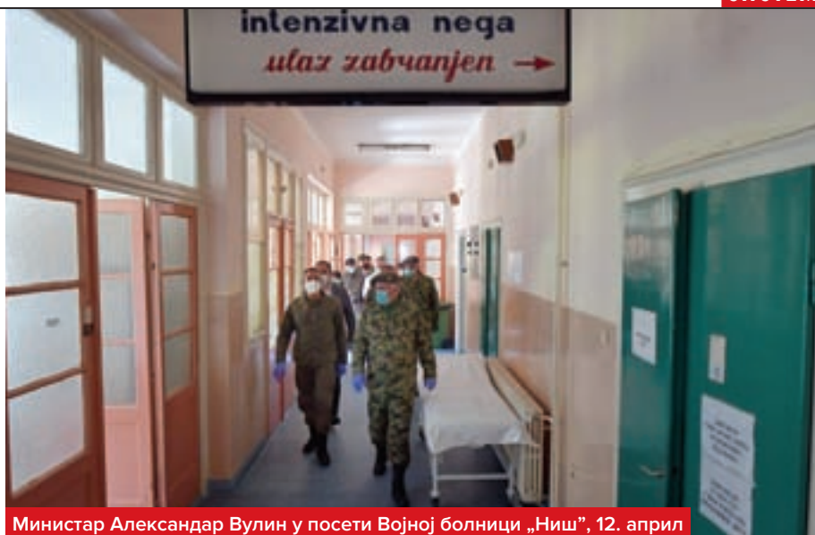
Министар Александар Вулин у посети Војној болници „Ниш”, 12. април

Највећа привремена болница за потребе смештаја лако оболелих од вируса корона, капацитета до 3.000 кревета, формирана је у Хали 1 Београдског сајма. Почела је са радом 29. марта. Први пацијенти са симптомима