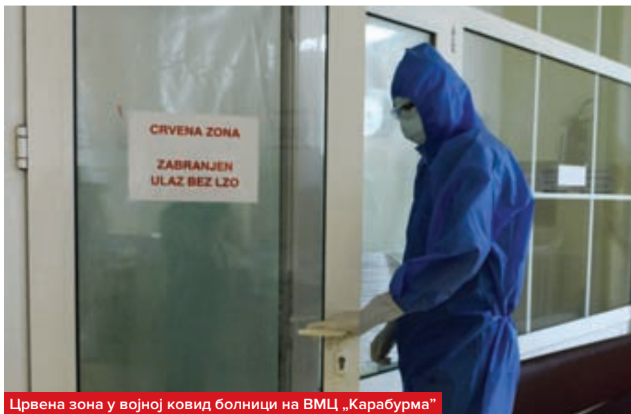
Црвена зона у војној ковид болници на ВМЦ „Карабурма”