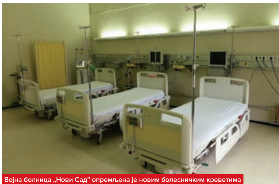
Војна болница „Нови Сад“ опремљена је новим болесничким креветима