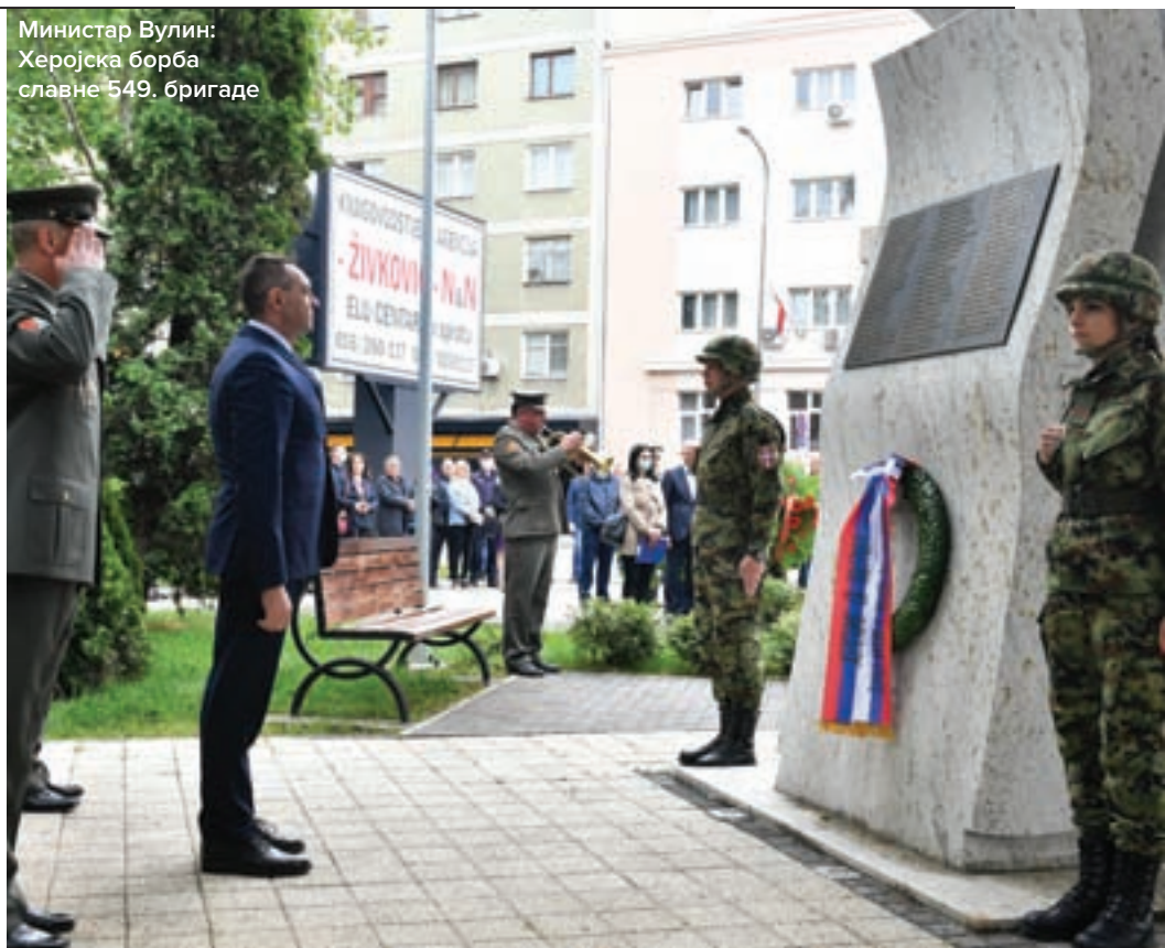
Министар Вулин: Херојска борба славне 549. бригаде

на, почетком маја састао се с амбасадорком НР Кине Чен Бо и кинеским експертима са којима је разговарао о резултатима заједничке борбе против епидемије вируса корона у Србији, када је изразио велику захвалност лекарском тиму кинеских стручњака.