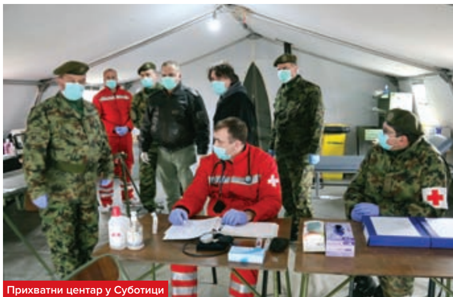
Прихватни центар у Суботици