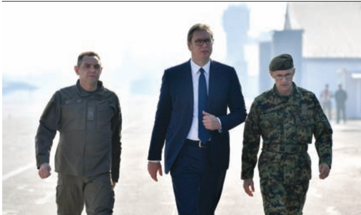
Председник Републике и врховни командант Војске Србије Александар Вучић у пратњи министра одбране и начелника Генералштаба на вежби „Словенски штит 2019”