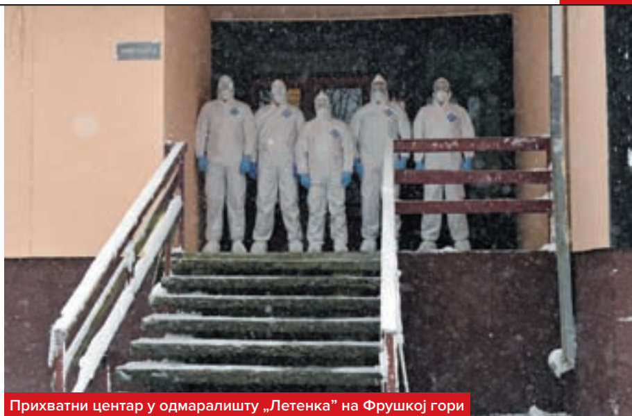
Прихватни центар у одмаралишту „Летенка“ на Фрушкој гори

И пре него што је уведено ванредно стање у нашој земљи, Група за снабдевање лековима и медицинским средствима Управе за војно здравство реализовала је набавке и обезбедила довољне количине заштитне опреме за ковид болнице и све војноздравствене установе које су планиране као ковид центри. Континуирано снабдевање војноздравствених устано-