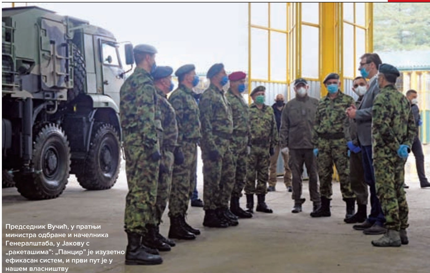
Председник Вучић, у пратњи министра одбране и начелника Генералштаба, у Јакову с „ракеташима”: „Панцир” је изузетно ефикасан систем, и први пут је у нашем власништву

ване самоходне хаубице 122 mm „гвоздика” на комплексу „Пасуљанске ливаде”, оценивши да је Војска Србије модернизацијом добила одлично артиљеријско оруђе.