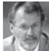
Др Миле Бјелајац Институт за новију историју Србије