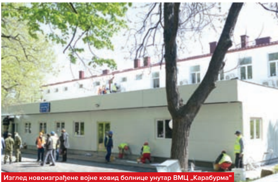
Изглед новоизграђене војне ковид болнице унутар ВМЦ „Карабурма“