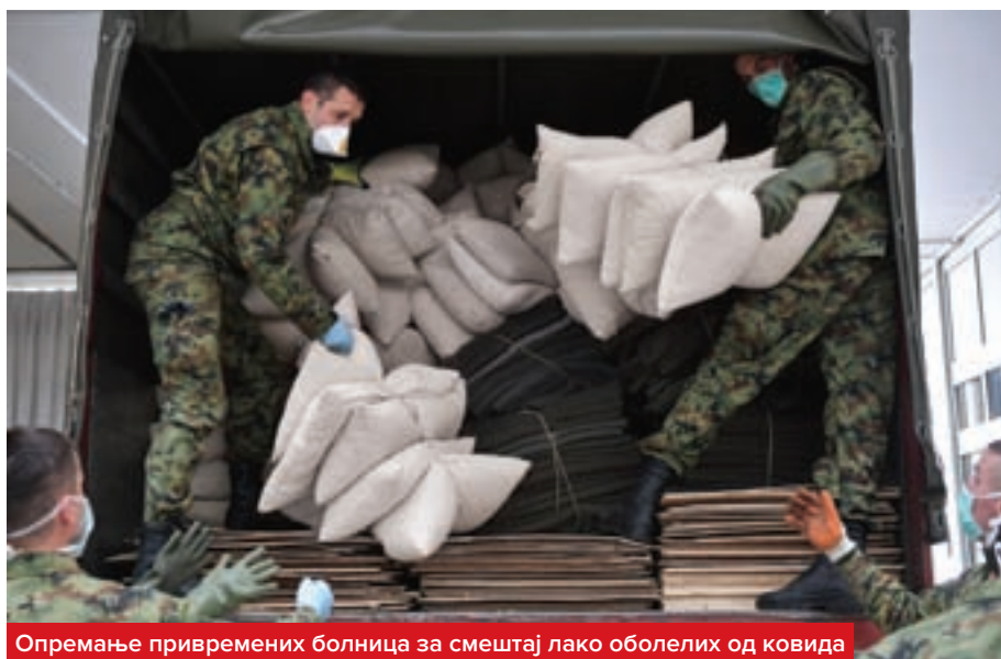
Опремање привремених болница за смештај лако оболелих од ковида