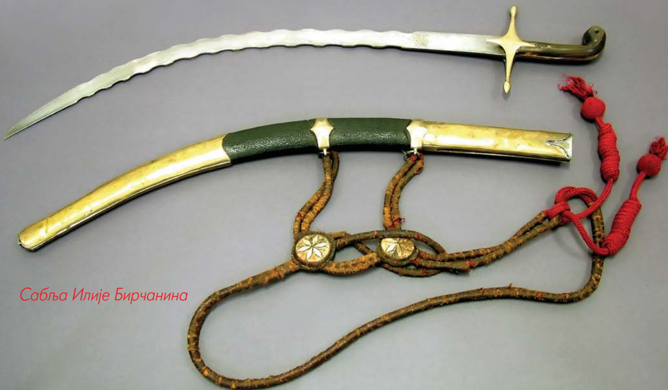
Сабља Илије Бирчанина