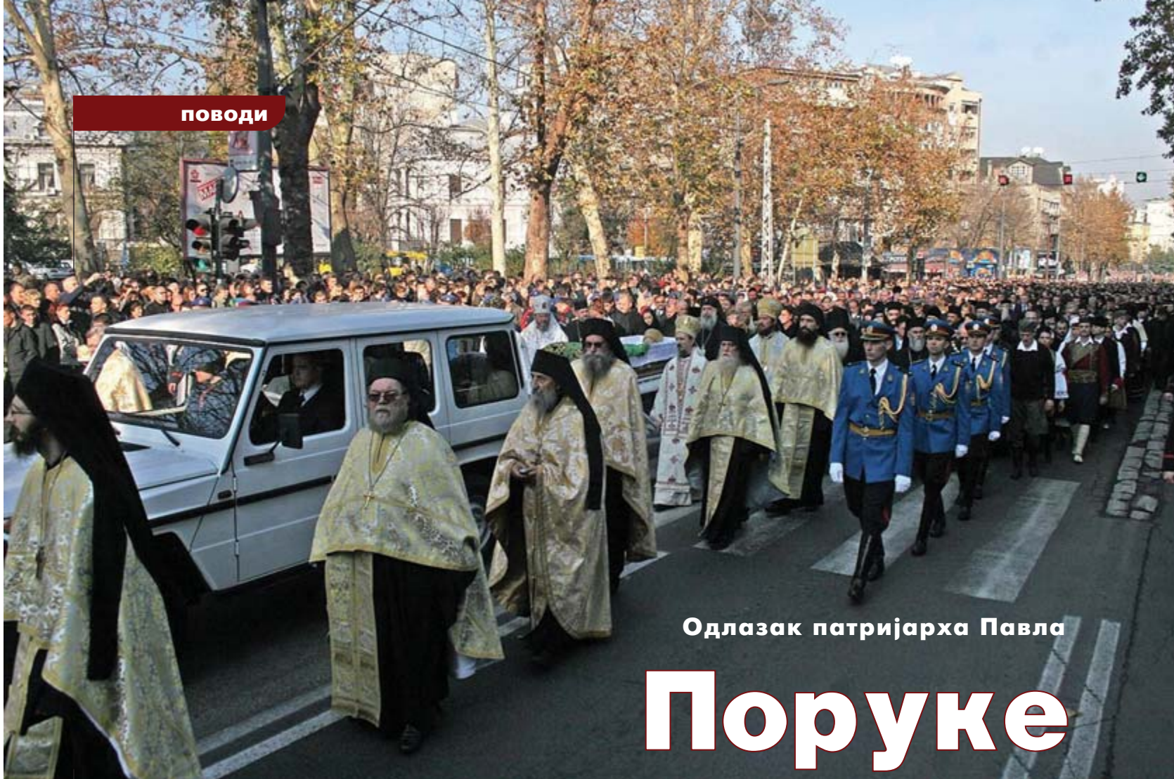
Одлазак патријарха Павла