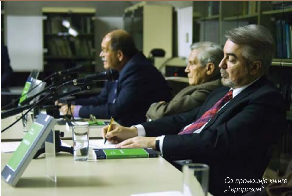
Са промоције књиге „Тероризам“

— О тим везама сам писао и говорио међу првима. Ипак нисам никад отишао тако далеко да као неки тврдим да је ОВК део