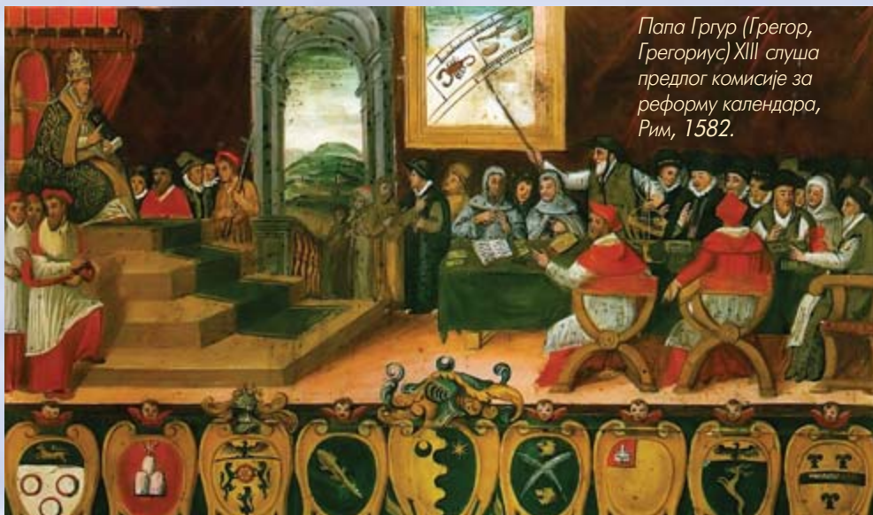
Папа Гргур (Грегор, Грегоријус) XIII слуша предлог комисије за реформу календара, Рим, 1582.

Нетачност датума званичног београдског празника можете и сами врло лако проверити. Прошетајте до Народне библиотеке Србије и затражите на увид дневну штампу из априла 1867. године. Упоредите наше Србске новине, које су датиране по Јулијанском календару, са једном дневном аустроугарском новином, која је датирана по Грегоријанском календару. Лако ћете се уверити да је и 6. април 1867. године у нашим новинама и 18. април исте године у страним новинама био четвртак, што говори да је реч о истом дану, и да разлика од 12 нумеричким јединица (за 19. век) представља разлику између два календара.