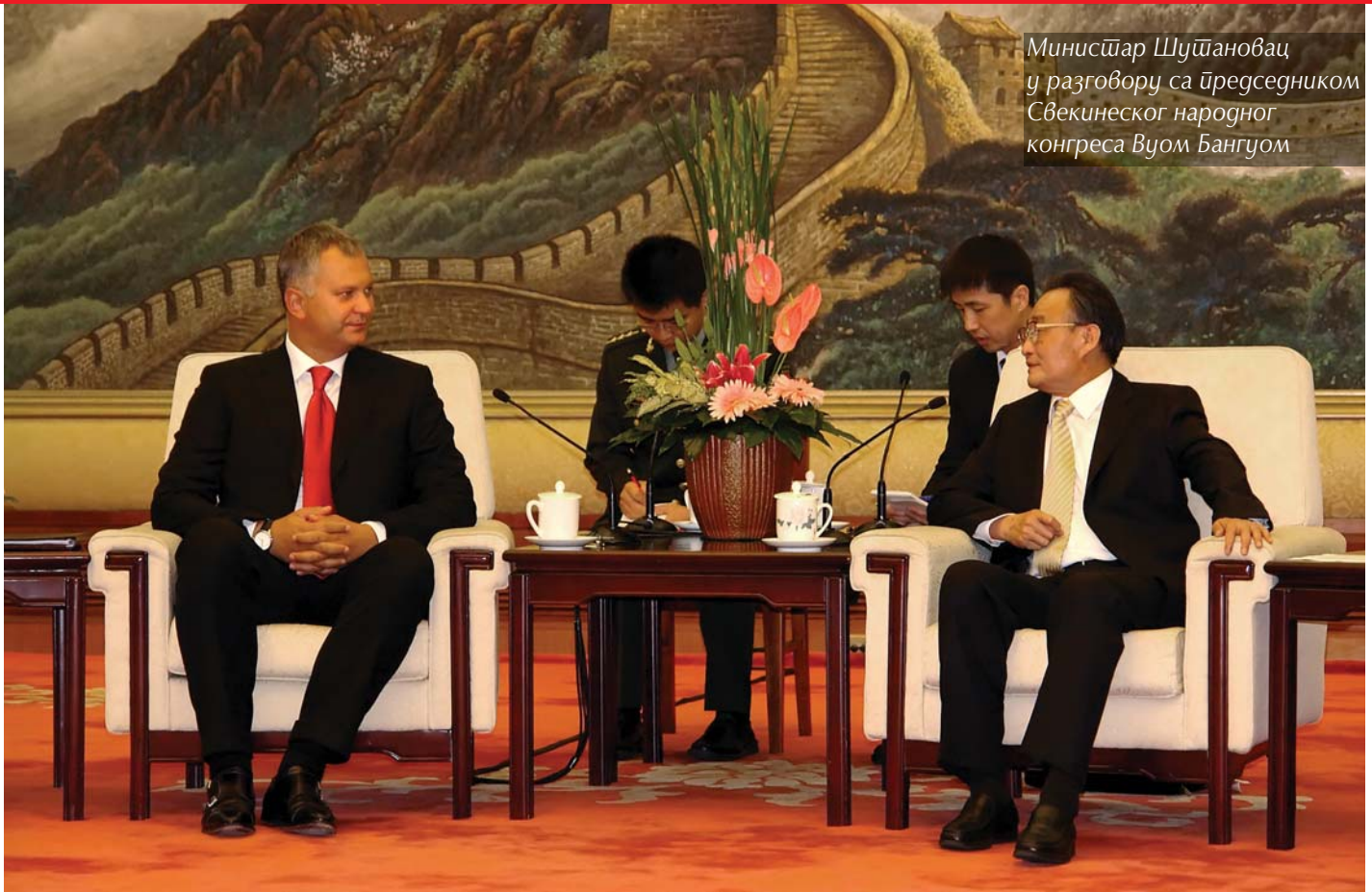
Министар Шутановац у разговору са председником Свекинеског народног конгреса Вуом Бангуом