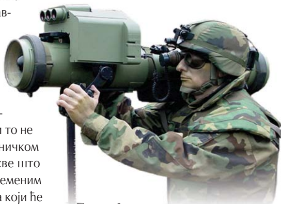
Противоклојни ракетни систем „бумбар“

– Мало је познато да Војска Србије газдује са импозантном количином смештајног капацитета нафтних деривата. Новина је да ће у име Министарства, оператер над тим бити Јавно предузеће „Транснафта“, које ће вишак складишног простора понудити енергетском сектору наше привреде уз обавезу бесплатног чувања неопходних количина за потребе Војске Србије. Део оствареног профита служиће за даље оспособљавање и осавремењивање складишних капацитета, а део и за подмиривање осталих потреба Војске.