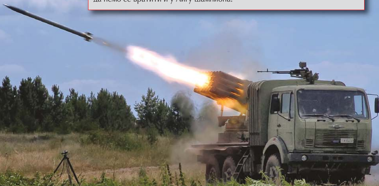
Ракетни систем „огањ“

До данас су 63 земље приступило примени НАТО кодификације. Не учинимо ли и ми то, бићемо избрисани са мапе произвођача наоружања и војне опреме. Потрчаћемо уласком у прву лигу, у Европску унију, а верујем да ћемо се вратити и у Лигу шампиона.