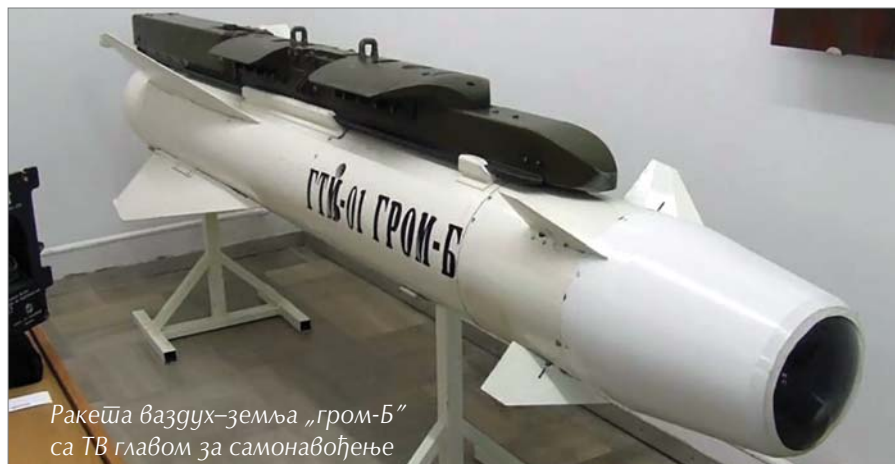
Ракета ваздух-земља „гром-Б“ са ТВ главом за самонавођење

– Утицаја система одбране на економију наше земље не би био потпун уколико не бисмо приказали учинке болне, али неизбежне трансформације која се дешава и у домену рада доходовних установа. Пре само три године имали смо тринаест војнодоходовних установа, од којих је једанаест пословало са губитком. Данас све послују позитивно. Ремонтне капацитете намењене одржавању технике КоВ и ВиПВО растеретили смо тржишног пословања јер тржишта и нема у одржавању на пример тенкова М-84, ТАМ-ових камиона, БОВ-а, „пинцгауера“, ракет-