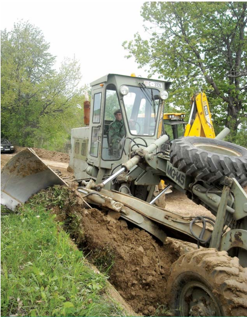
Инжињеријски батаљон Друге бригаде