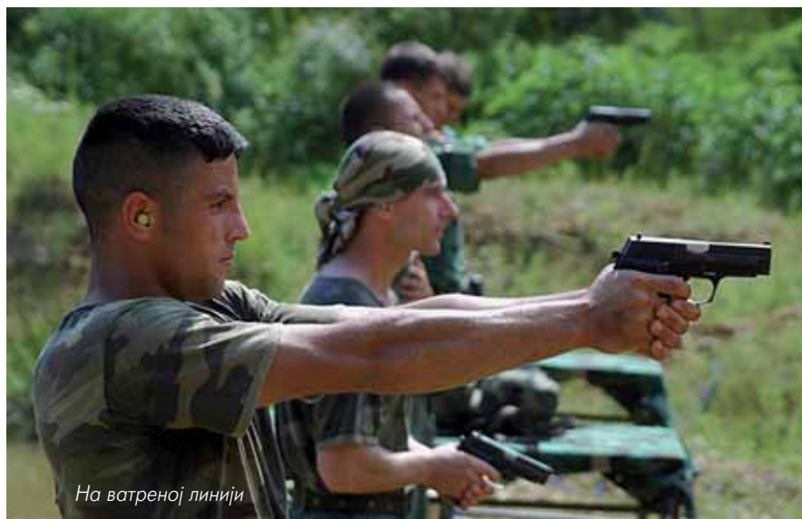
На ватреној линији

Протеклог викенда у Нишу одржан је 9. падобрански вишебој, једно од најтежих и најпрестижнијих такмичења специјалних јединица. На старту се појавило укупно дванаест екипа: четири екипе 63 . падобранске бригаде која је била домаћин и организатор такмичења, две из