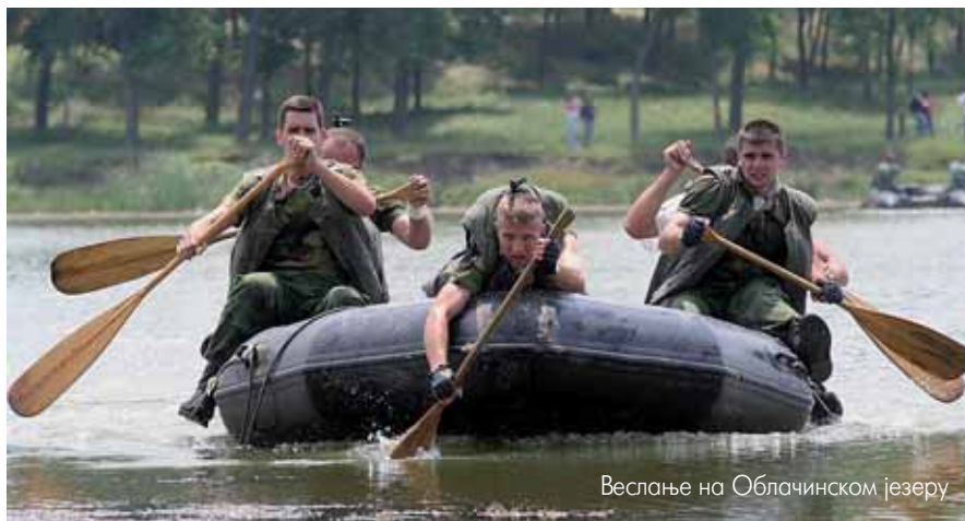
Веслање на Облачинском језеру