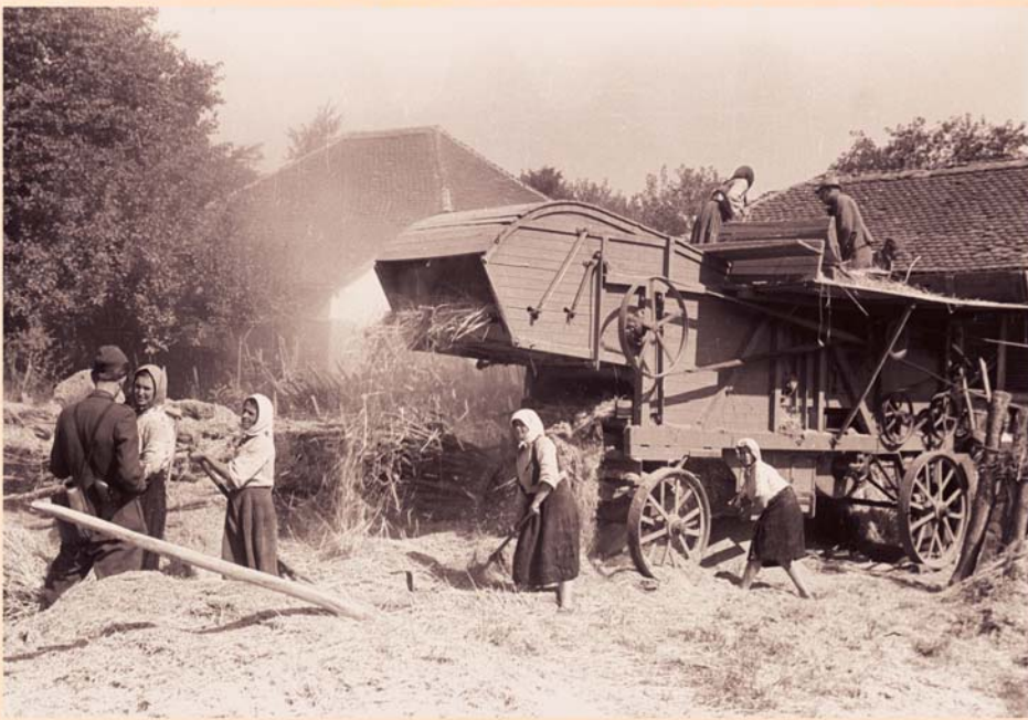
Вршидба у околини Ђуприје (лето 1945.)