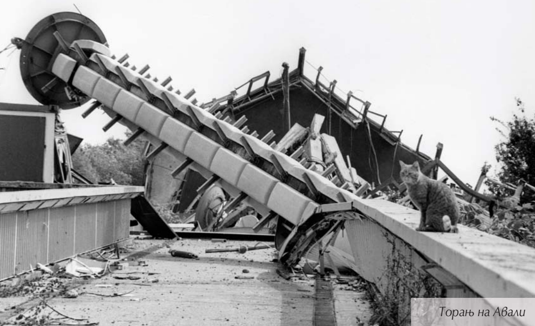
Торањ на Авали