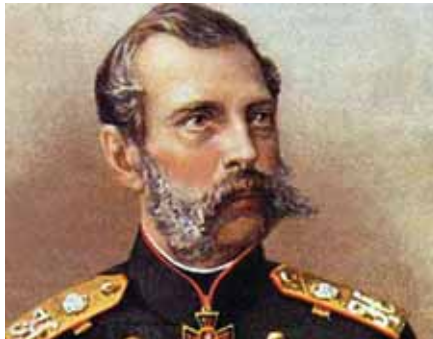
Руски цар Александар Други

Хусеин је био у потпуности свестан немоћи на бојном пољу и радо је прихватио своју судбину – не због политичке амбиције, већ је заузео морални став против неправде и тираније. Његова лична посвећеност и непоколебљива спремност на жртвовање, послужила је као пример не само за шиите, већ за све муслимане у нади да ће изаћи на крај са неморалним владарима, који су тврдили да су праведни муслимани. Премда то није био самоубилачки напад у строгом смислу, пример Хусеиновог мучеништва је инспирисао знатан број савремених терориста самоубице.