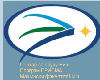
Центар за обуку Ниш Програм ПРИСМА Машински факултет Ниш

У самом Центру успостављена је организација рада која углавном задовољава потребе официра, а као крајњи циљ пружа кандидатима специфична знања и вештине, припрема их за рад у конкретном радном окружењу и обезбеђује им наставак каријере у рангу високообразованог кадра.