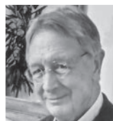
Кристер Карпхамер аутор књиге „Земља безакоња”