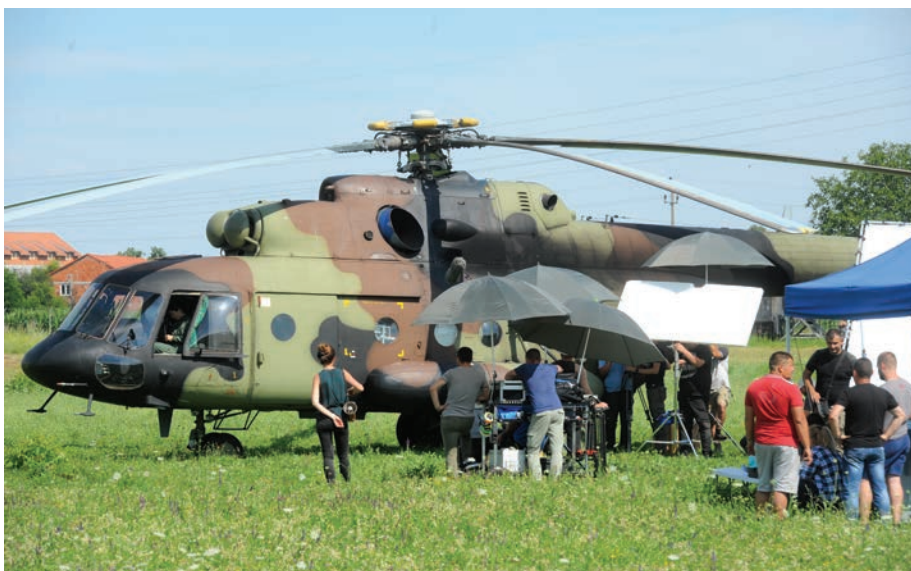
Снимање на теренима Специјалне бригаде у Панчеву