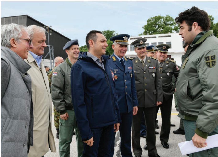
Министар одбране, командант РВ и ПВО и директор Јавног сервиса са сарадницима