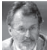
Др Миле Бјелајац Институт за новију историју Србије