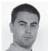
Владе Радловић војно-политички аналитичар