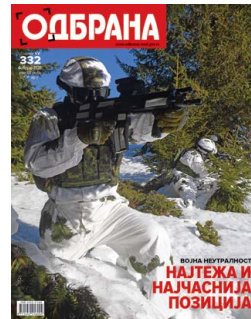
Насловна страна Обука специјалаца на Копаонику

Припадамо српском роду и ту смо да бисмо помагали једни друге и увек ћемо то чинити – рекао је председник Републике Србије приликом свечаног отварања погона фабрике „Јумко“ у Дрвару.