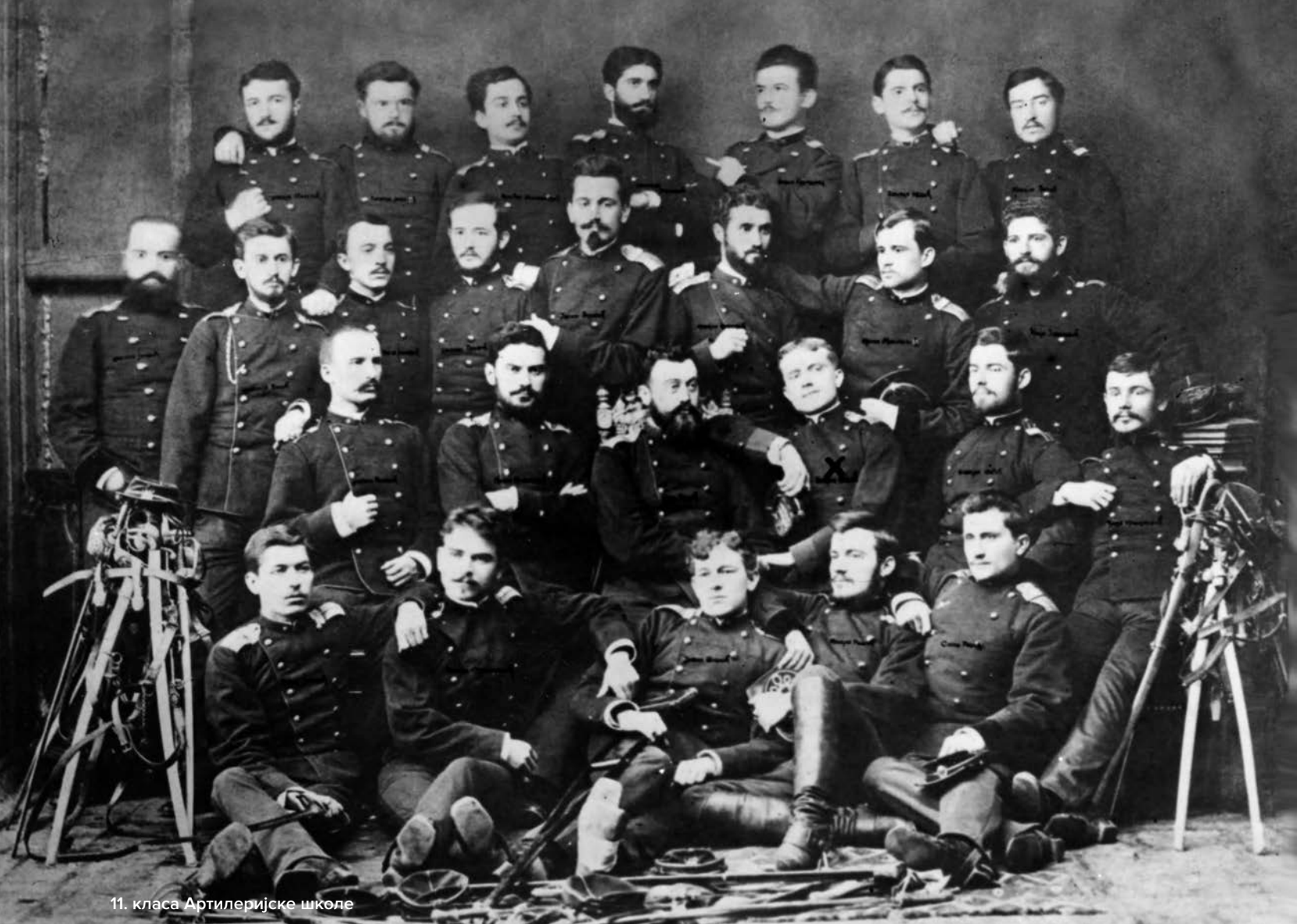
11. класа Артиљеријске школе