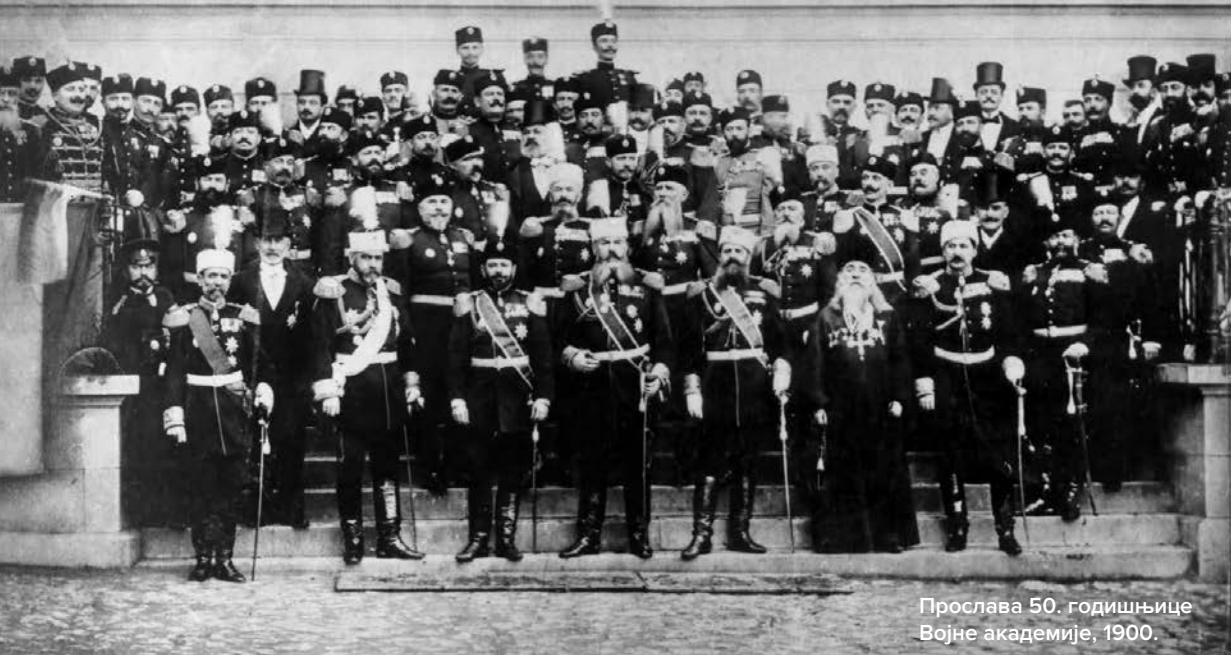
Прослава 50. годишњице Војне академије, 1900.