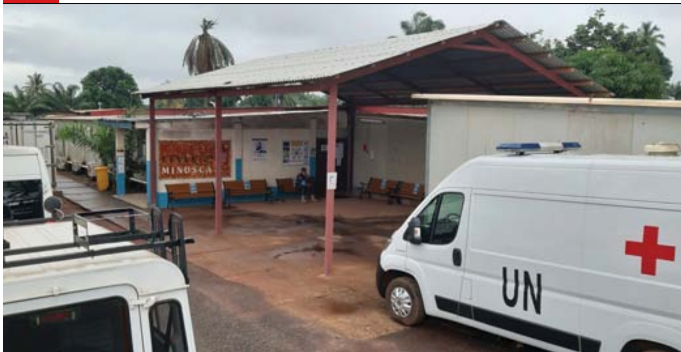
Српска болница у Бангију