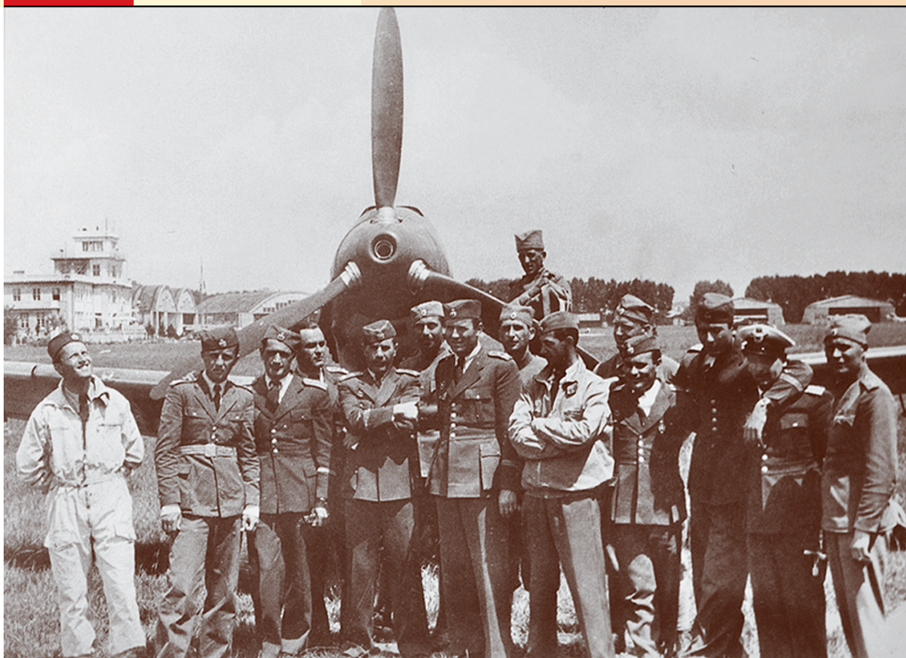
Пилоти 6. ловачког пука ЈРВ

мљорадничкој и Самосталној демократској странци. Према процени њеног шефа Хјуа Далтона, општи трошкови британске круне у Југославији за стварање погодне климе уочи пуча од 27. марта 1941. износили су више од 100.000 британских фунти или 17.650.000 ондашњих динара, што је било око девет пута више од новца који је Британија уложила у пропагандне сврхе у Југославији од почетка рата до средине 1940. године.