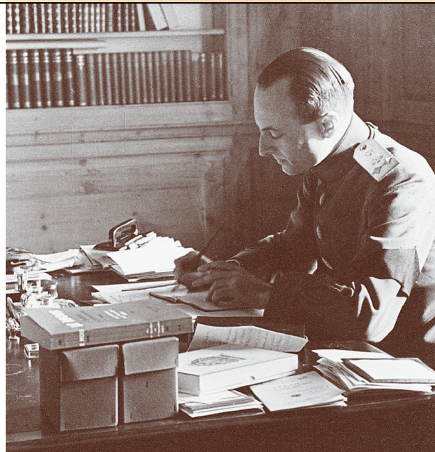
Кнез Павле Карађорђевић у радном кабинету

Свакако један од узрока који су инспирисали преврат био је и хрватско-српски спор око преуређења Југославије, који се захуктао баш након оснивања „Конспирације”. На-