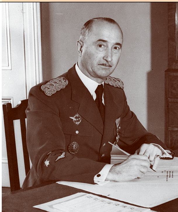
Генерал Душан Симовић

Британска агентура припремала је превентивно терен за пуч и кроз контакте са провереним људима из југословенске војске који би могли бити од користи приликом његовог спровођења. Тако је шефу „М-одсека” – тајног сервиса југословенске војне обавештајне