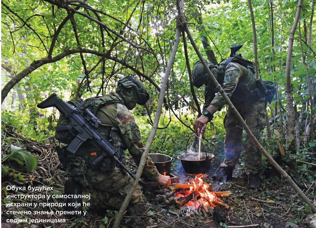
Обука будућих инструктора у самосталној исхрани у природи који ће стечено знање пренети у својим јединицама

И пре него што ћемо започети верање рашчистили смо да ће трајати онолико колико ће нам стена дозволити. Ипак, желимо да то обавимо што пре.