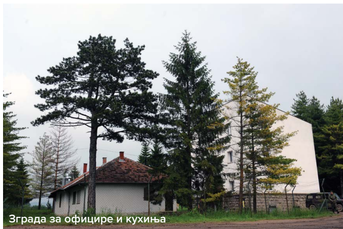
Зграда за официре и кухиња