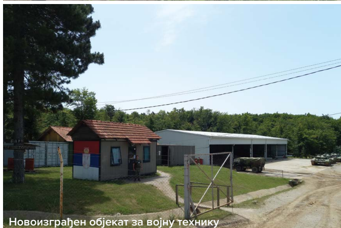
Новоизграђен објекат за војну технику