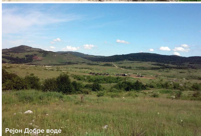
Рејон Добре воде