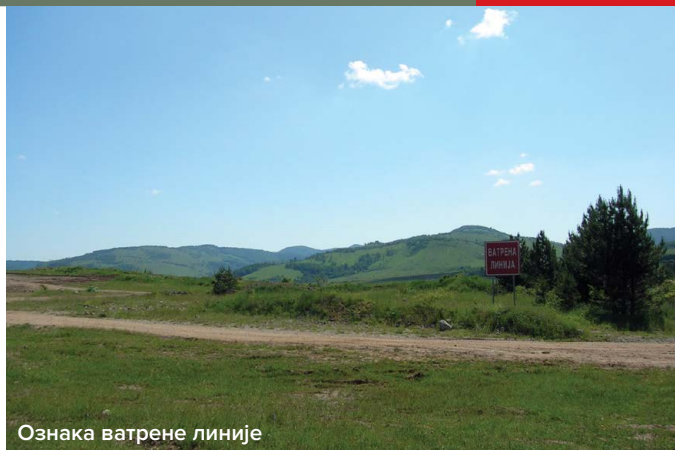
Ознака ватрене линије