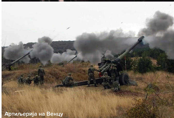
Артиљерија на Венцу