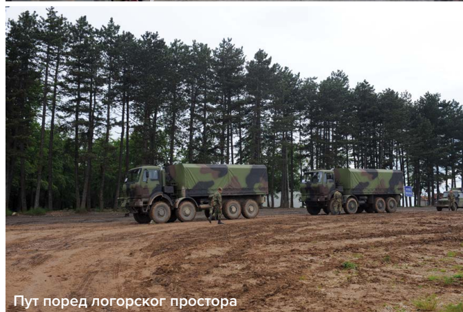
Пут поред логорског простора