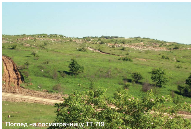
Поглед на посматрачницу ТТ 719