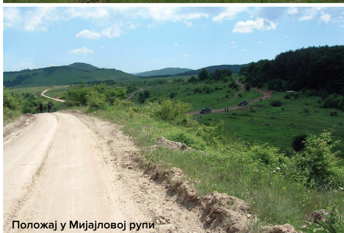
Положај у Мијајловој рупи