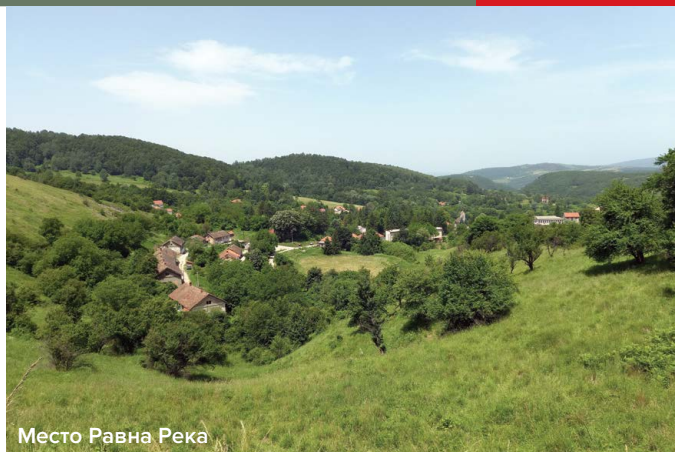
Место Равна Река

Без сумње, Војска је већ више од два века саставни део овог краја, а биће и убудуће. Ми ћемо нашу полигонску причу завршити војно и пожелети успех екипи Копнене војске која се ту од 3. до 20. јула припремала за учешће на Тенковском бијатлону у Русији. |