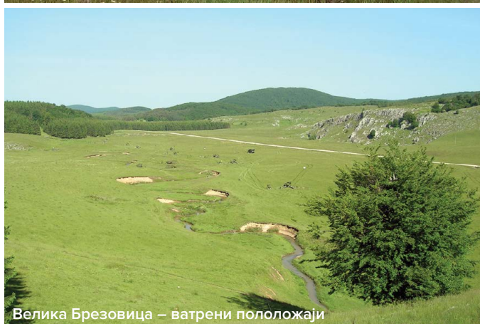
Велика Брезовица – ватрени положаји