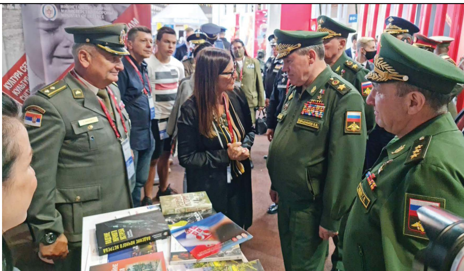
Изложбени штанд Србије у Дому дружбе посетио је начелник Генералштаба Оружаних снага Руске Федерације генерал армије Валериј Герасимов

– Нема места за калкулације. Максимално да се приђе до препреке и што агресивније. Али пазите, саме препреке, поготово најопасни-