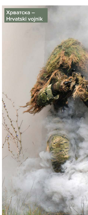
Хрватска – Hrvatski voјnik