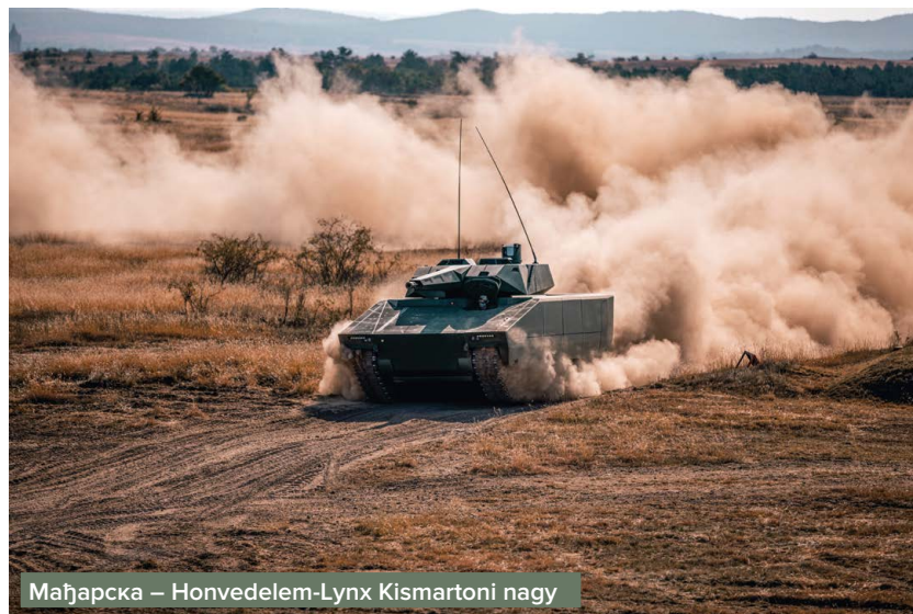
Мађарска – Honvedelem-Lynx Kismartoni nagy