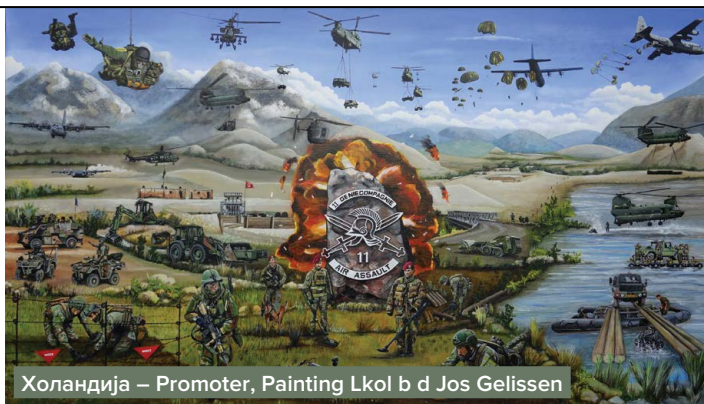
Холандија – Promoter, Painting Lkol b d Jos Gelissen

Значајно је и одржавање контаката и могућност размене текстова, фотографија и видео-прилога који су од интереса за поједине редакције, као и учешће на појединим стручним скуповима на теме из области одбране и безбедности које организују ЕМРА или министарства и армије држава чланица. |