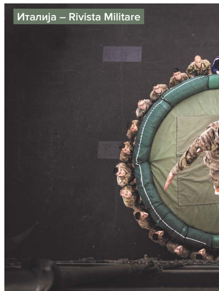
Италија – Rivista Militare