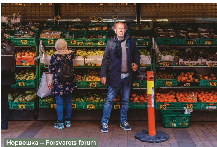
Норвешка – Forsvarets forum