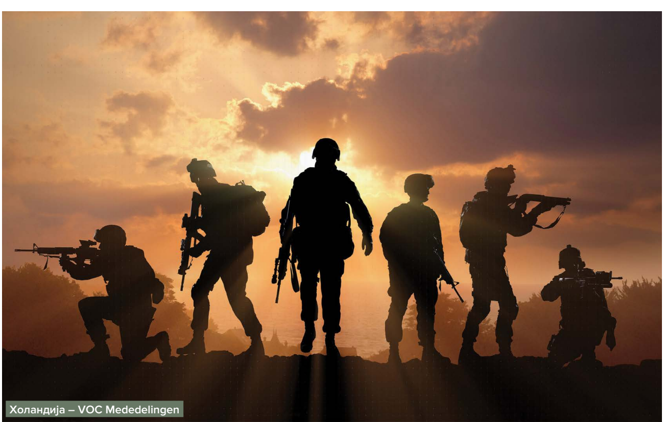
Холандија – VOC Mededelingen