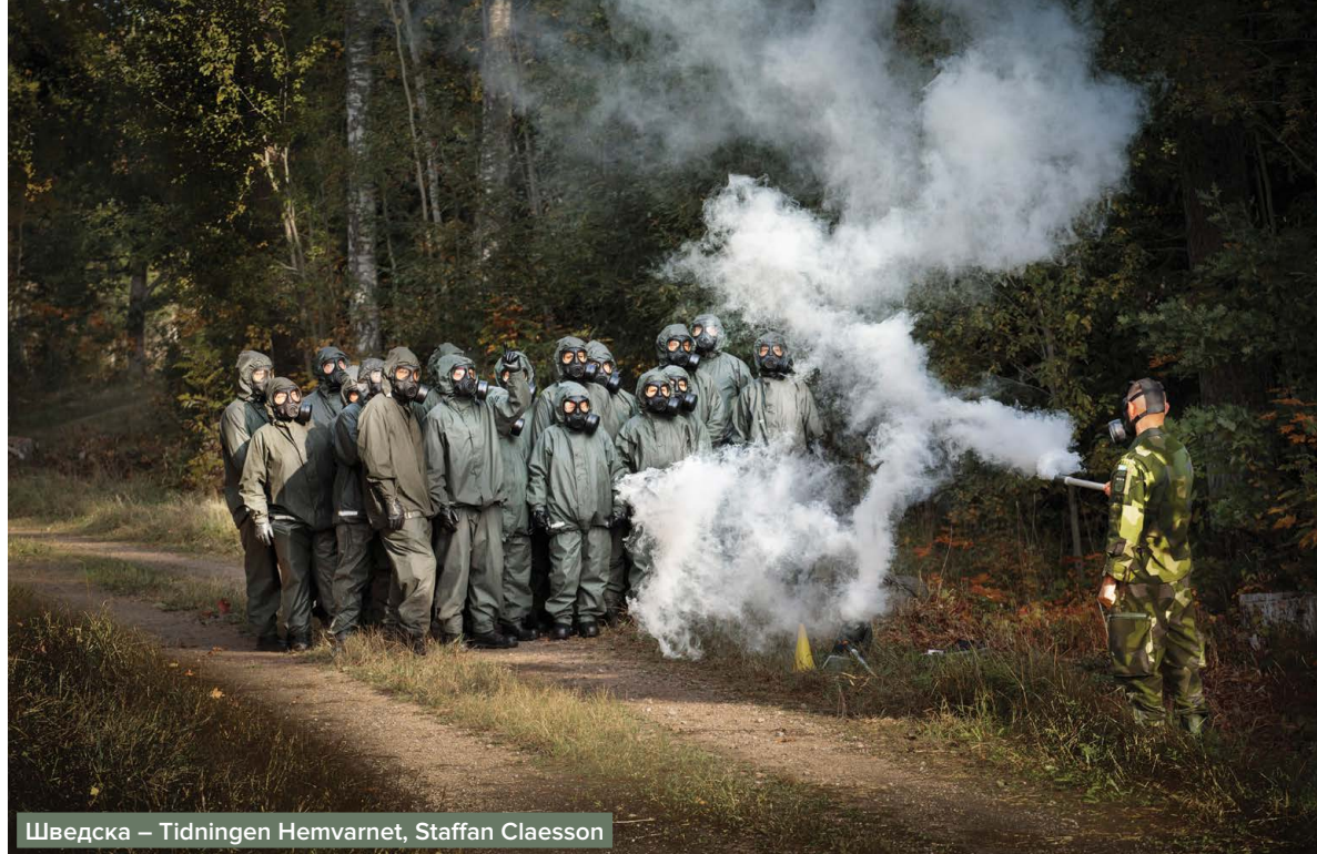
Шведска – Tidningen Hemvarnet, Staffan Claesson