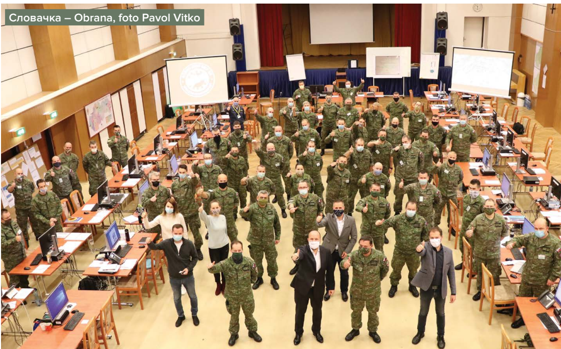
Словачка – Obrana