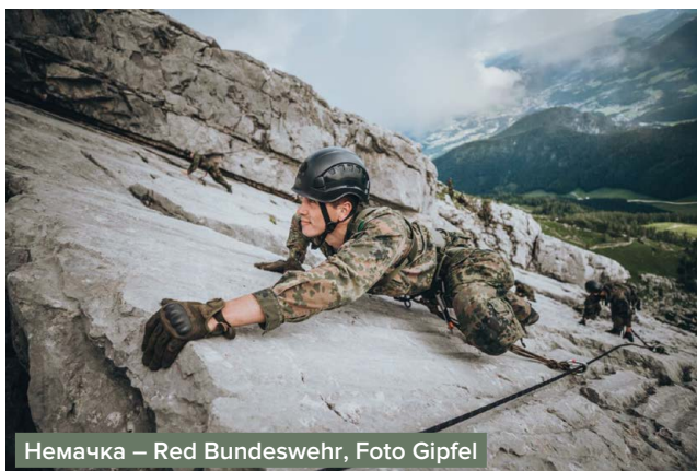
Немачка – Red Bundeswehr, Foto Gipfel