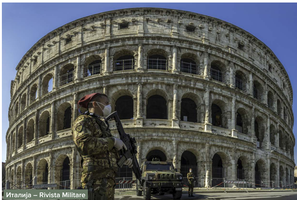
Италија – Rivista Militare