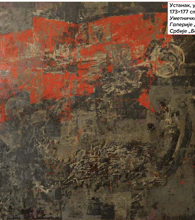
Устанак, уље на платну, 173×177 cm, 1966. Уметничка збирка Галерије Дома Војске Србије „Београд”

ци Дома Војске Србије је још један пејзаж, Маслиник из 1939. године, овог пута доведен скоро до форме симбола, који нас полако уводи у следећу фазу Лубардиног живота и рада.