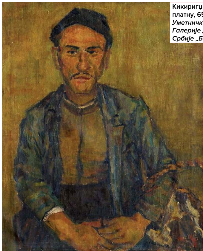
Кикиригиџија, уље на платну, 65×54 см, 1934. Уметничка збирка Галерије Дома Војске Србије „Београд”

јег у нашу средину, сликарски већ развијену, шаље Париз, пошто га је непосредно једини однеговао и пустио онако у свет са првим сазнањем о свом дару сликарству и уметничком аскетизму, са првим сазнањем о својој будућој целој животној судбини... Ако се обрете у тим двома собама и без неке нарочите жеље да гледате слику по слику, па застанете под том топлотом визија које зраче, нуди вам се изванредан утисак о једном јединственом осећању боје којој се, нема сумње, Лубарда радује и коју воли до мистичнога знаменовања. Боја за њега садржи више него матери-