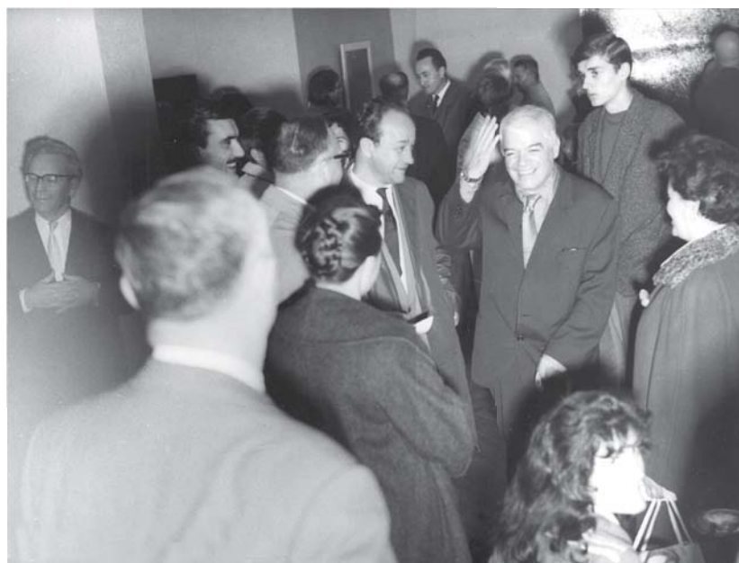
Фотографија са отварања самосталне изложбе Петра Лубарде 1964. у Галерији Дома ЈНА

тао се од већ поменутог пејзажа, преко портрета, ентеријера, мртве природе, до жанр-сцена. Пределе из родног краја Петар Лубарда је први пут изложио пред београдску публику у мају 1933, на изложби приређеној у Ратничком дому (данас Дом Војске Србије – Медија центар „Одбрана”), у просторијама Француског клуба, где су се нашла 33 уља на платну, од париских пејзажа, преко пејзажа Црне Горе, Далмације и Београда, као и композиције урбане тематике донете из Париза.