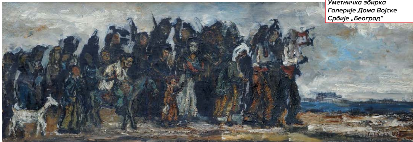
Збег из Шпаније, уље на платну, 31,5×89,5 см, 1936. Уметничка збирка Галерије Дома Војске Србије „Београд”

Међу последњим делима из међуратног периода које су чува у Уметничкој збир-