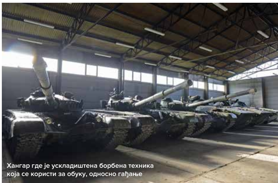
Хангар где је ускладиштена борбена техника која се користи за обуку, односно гађање

– Ударни период је целе године, мало се застане око јануарских празника. Статистика коју водим кроз дневник говори о импозантним цифрама – током ове године на стрелишту је забележено 118 дана гађања – тенковских, пешадијских, вежбовних – и на њима је присуствовало око 4.000 извршилаца гађања.