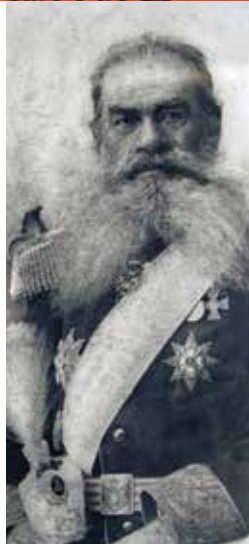
ПУКОВНИК Јован Драгашевић

ПОКРЕТАЧ И ПРВИ ОДГОВОРНИ УРЕДНИК РАТНИКА 1879-1888. НАЧЕЛНИК ИСТОРИЈСКОГ ОДЕЉЕЊА ГЛАВНОГ ЂЕНЕРАЛШТАБА