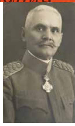
ПУКОВНИК Душан Пешић

УРЕДНИК РАТНИКА 1914. ГОДИНЕ НАЧЕЛНИК ИСТОРИЈСКОГ ОДЕЉЕЊА ГЛАВНОГ ЂЕНЕРАЛШТАБА