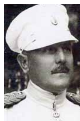
ПОТПУКОВНИК Војин Максимовић

ПРВИ УРЕДНИК ОБНОВЉЕНОГ РАТНИКА 1921. ГОДИНЕ В. Д. НАЧЕЛНИКА ИСТОРИЈСКОГ ОДЕЉЕЊА ГЛАВНОГ ЂЕНЕРАЛШТАБА