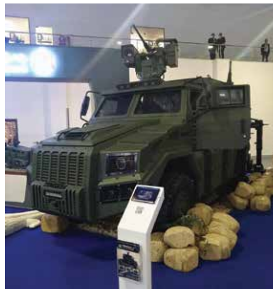
Возило Temsah 4 приказано на штанду египатског излагача

Код оклопног возила Temsah 3 максимална брзина је 125 km/h, без обзира на то да ли је реч о кабинској или пик-ап варијанти. Као решење примењена је аутоматска трансмисија, а домет кретања возила са максималном тежином од 6,4 тоне износи 442 километра. Максимална тежина возила Temsah 4 погона на сва четири точка износи 15 тона, трансмисија је аутоматска,