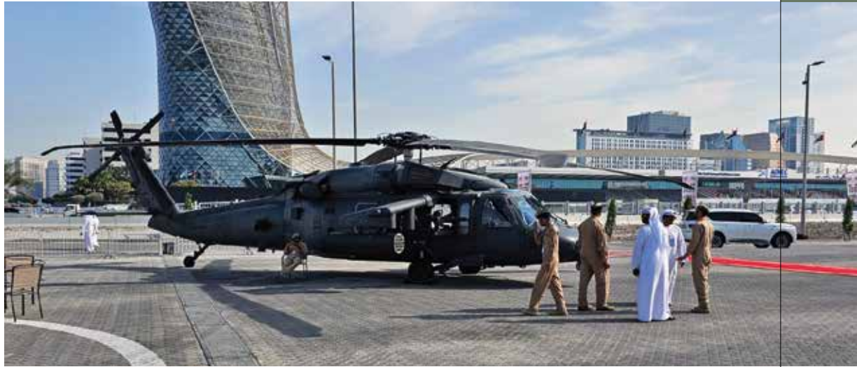
Отворени део изложбеног простора

Француски тенк Leclerc већ дуго је познат светској јавности, будући да је први примерак француској армији предат још 14. јануара 1992. године. Основна ватрена моћ садржана је у топу калибра 120 mm дужине 52 калибра, а борбени комплет садржи 40 пројектила, односно 22 у аутоматском пуњачу и још 18 у смештајном блоку унутар предњег дела платформе. Са овим топом спрегнут је митраљез калибра 12,7 mm, а на врху куполе налази се још један митраљез, односно даљински управљана борбена станица у калибру 7,62 mm. Тенк погони осмоцилиндрични турбодизел-мотор који генерише 1.500 КС и омогућава достизање максималне декларисане брзине по уређеним путевима од 71 km/h, односно 50 km/h ван пута. Аутономија кретања је 550 km, односно 650 km са додатним резервоарима. У основи, капацитет резервоара износи 1.300 литара, уз могућност интеграције и два помоћна резервоара запремине од по 200 литара. У зависности од верзије, тежина се креће између 54,5 до 57,5 тона, укључујући и најмодернију верзију са побољшаним оклопом и системом управљања ватром. Иначе, Уједињени Арапски Емирати учествовали су као партнери у програму даљег унапређења овог тенка, па отуда не чуди зашто је та блискоисточна земља и његов највећи корисник.