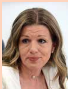
Проректор Ивана Стевановић

У делокругу рада Одељења посебан значај има обрада библиотечке грађе, како материјална и физичка, тако и библиографско-каталожка и садржинска. У циљу пружања што квалитетнијег приступа корисницима, континуирано се ради на развоју јединственог библиотечко-информационог система и аутоматизацији библиотечког пословања на Универзитету одбране.