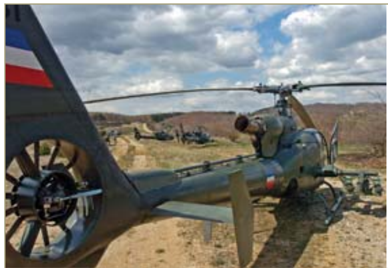
Хеликоптер „газела“ из састава 119. хеликоптерског пука