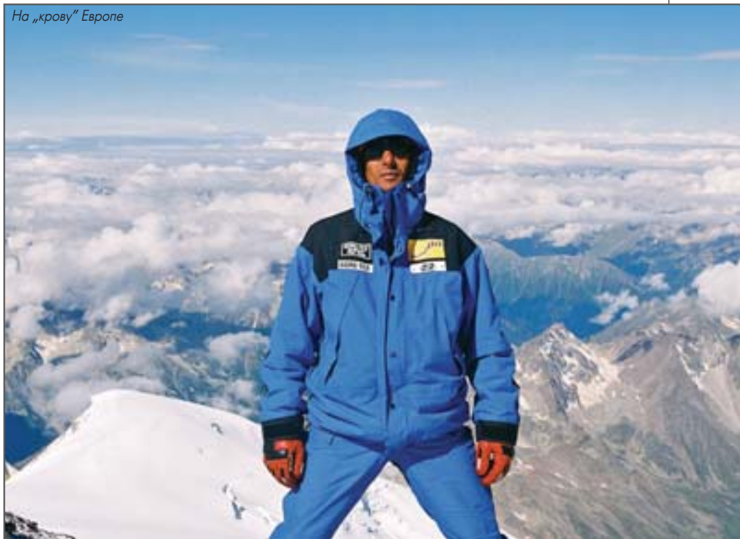
На „крову“ Европе

На детаљним лекарским прегледима једнодушна оцена: челично здравље. На проверама физичке спремности – рекордни резултати. Уз слу-