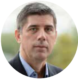
Пише Александар СКАКИЋ