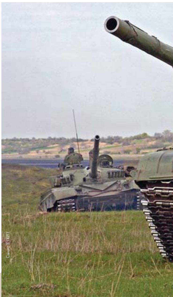
Слика 3. ПЕРГЕ

И неповољна кадровска пирамида с почетка прошле године – структура официра по чиновима, умногоме је направљена. Број старешина чина потпоручник – капетан прве класе, у априлу 2007. године, износио је више од 60 одсто, што је за око шест одсто боље.